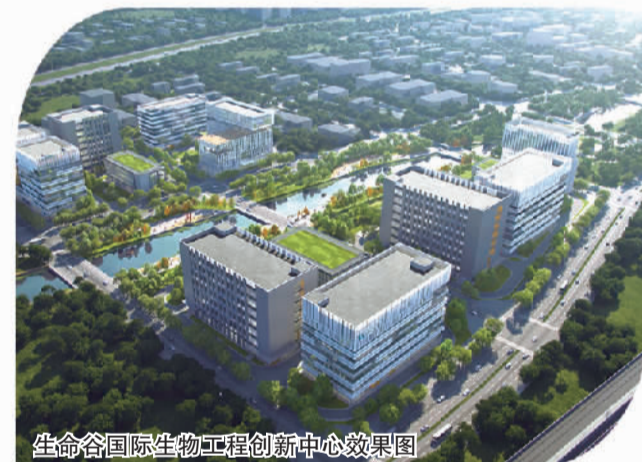
生命谷国际生物工程创新中心效果图