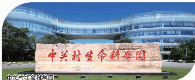
中关村生命科学园

经过多年培育,生命科学园已经进入创新成果的爆发期,涌现出高精度个性化脑功能分割技术等一批具有世界影响力的原创成果。百济神州、诺诚健华等研制出一批中国原创新药走向世界,博雅辑因、数坤科技等陆续推出一批全球全国首创产品。2022年,全区医药健康产业收入、产值分别达800亿元、304亿元,近三年年均增速分别为14%、19%,昌平区生命科学产业集群入选工信部“2022年度国家中小企业特色产业集群名单”。