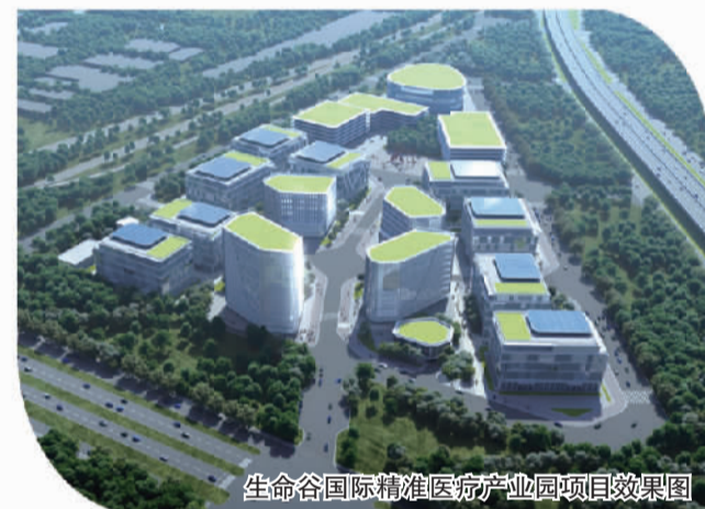
生命谷国际精准医疗产业园项目效果图