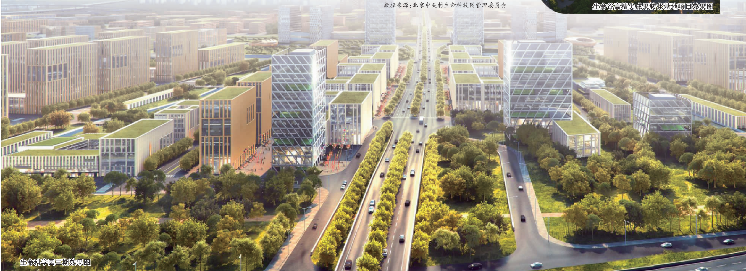
生命科学园三期效果图