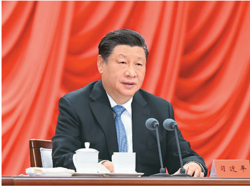
3月1日,中共中央党校建校90周年庆祝大会暨2023年春季学期开学典礼在北京举行。中共中央总书记、国家主席、中央军委主席习近平出席并发表重要讲话。

■ 党校始终不变的初心就是为党育才、为党献策。各级党校要坚守这个初心,锐意进取、奋发有为,为全面建设社会主义现代化国家、全面推进中华民族伟大复兴作出新的贡献