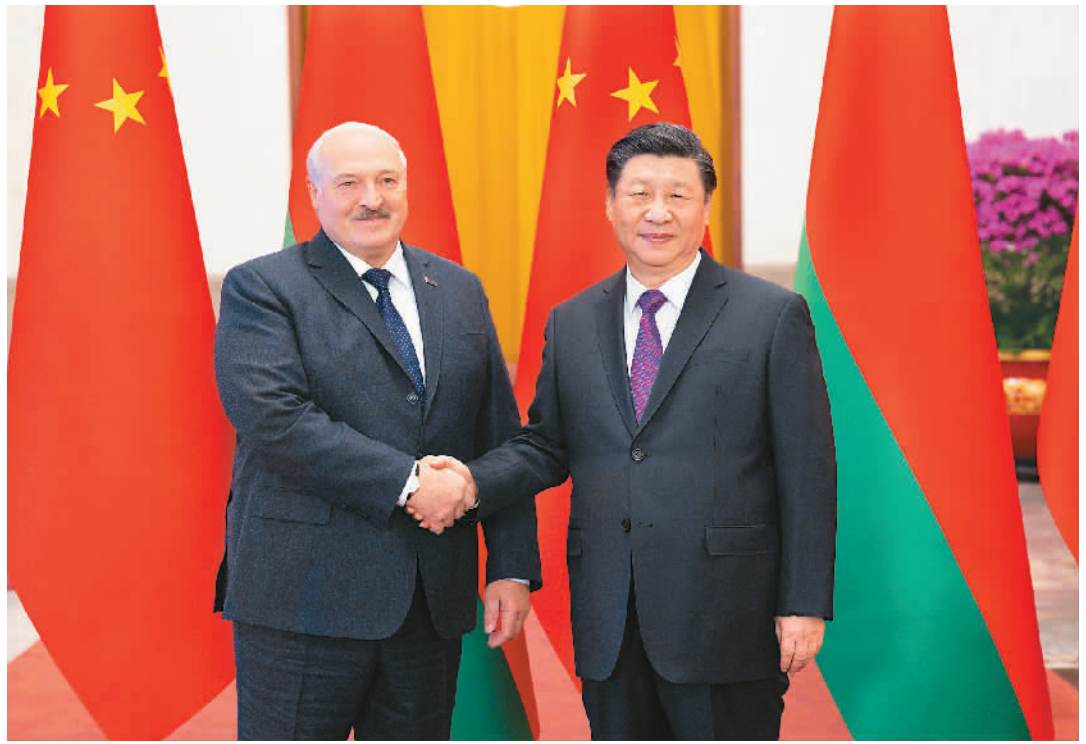
三月一日,国家主席习近平在北京人民大会堂同来华进行国事访问的白俄罗斯总统卢卡申科举行会谈。这是会谈前,习近平在人民大会堂北大厅为卢卡申科举行欢迎仪式。