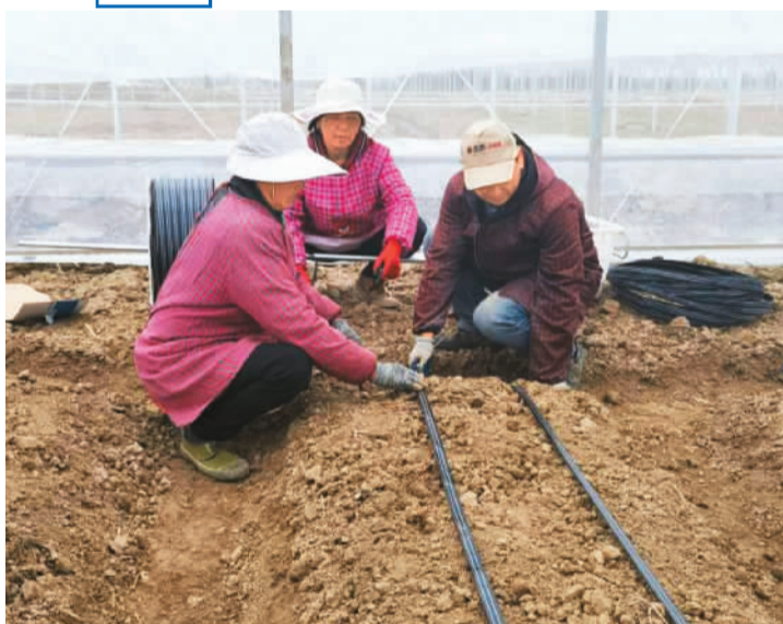
南岚湾现代农业示范园正在铺设滴灌系统。