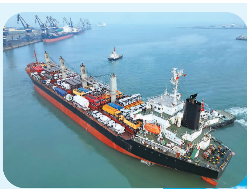
2月23日，中非班轮“塔内斯梦想”轮从山东港口烟台港起航，前往坦桑尼亚达累斯萨拉姆港。

致公党中央准备的《关于深化电力体制改革 统筹推进碳达峰碳中和的提案》指出，践行“双碳”目标，能源是主战场，电力是“重头戏”。提案整合实地调研成果，指出了电力体制改革与市场化建设目前存在的突出问题，并提出深化电力体制改革、构建适应于高比例消纳可再生能源的电力体制等相关建议。