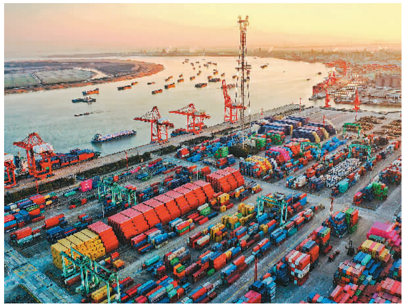
近日，在长江张家港段，一艘艘装载生产生活物资的船舶在江面上往返穿梭，港口呈现一派繁忙景象。

本报北京2月28日电（记者廖睿灵）国内生产总值超121万亿元，再次跃上新台阶！国家统计局28日发布的2022年国民经济和社会发展统计公报显示，2022年，中国国内生产总值1210207亿元，比上年增长3%。中国在世界经济体量排名靠前的主要经济体中增速领先，经济总量持续扩大，发展基础更加坚实，综合国力进一步增强。