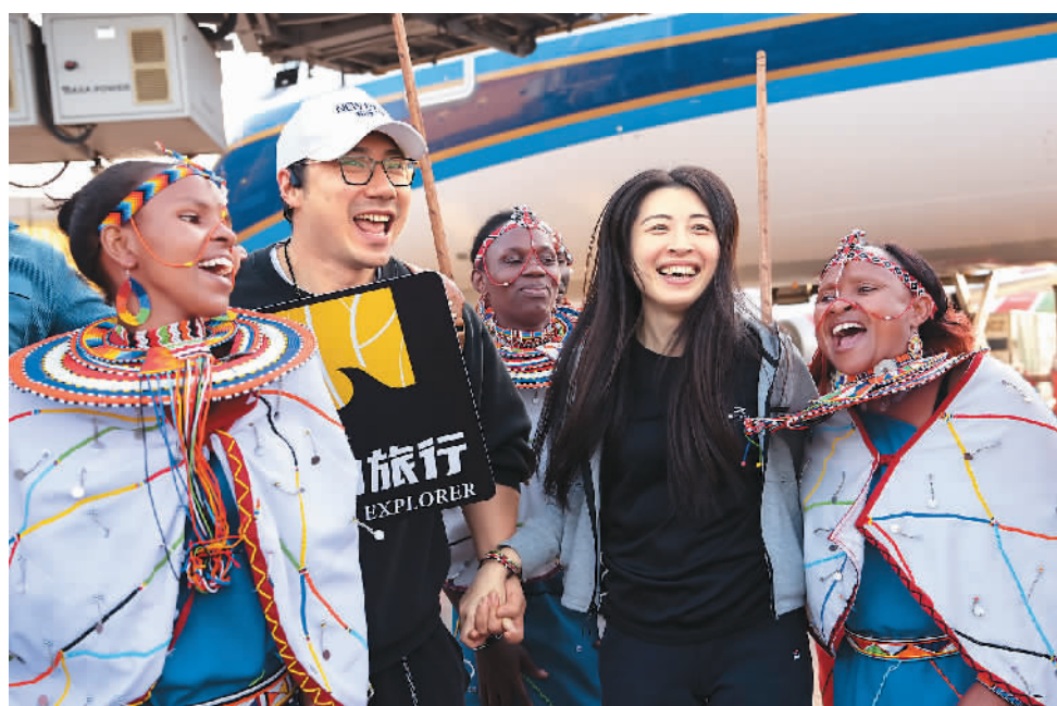
近日，在肯尼亚首都内罗毕乔莫·肯雅塔国际机场，中国游客和肯尼亚演员互动。