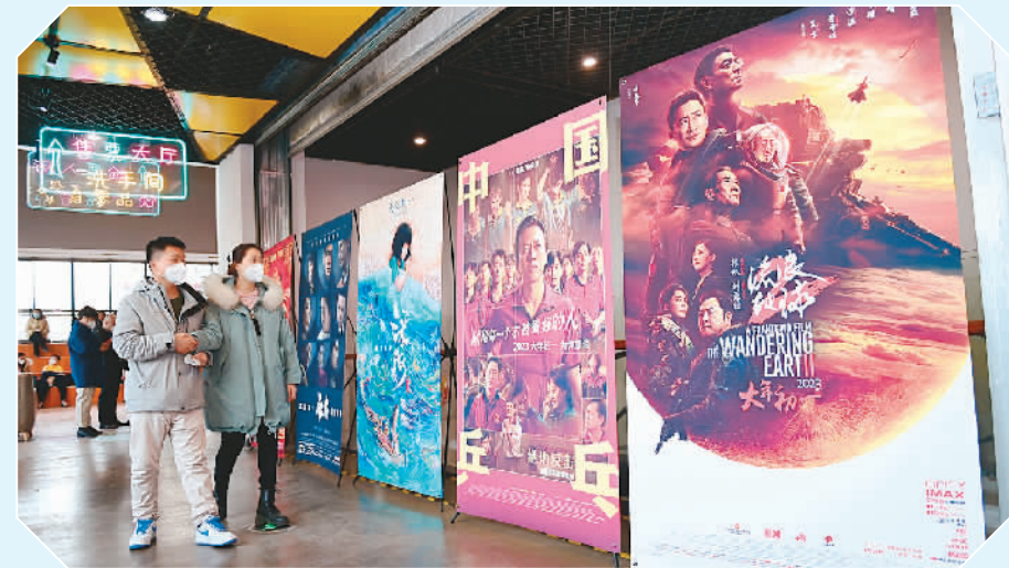
市民在陕西省西安市长安区一家影城购票观影。