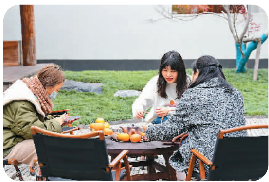
在江西赣州一家中式茶馆，几名年轻人围坐在一起体验“围炉煮茶”。

近年来，传统茶文化作为一种社交消遣，在中国受到极大关注。一个典型例子就是围炉煮茶：一群人围在炉子旁煮茶、闲聊，让人想起许久以前他们的先辈就很享受这种场景。