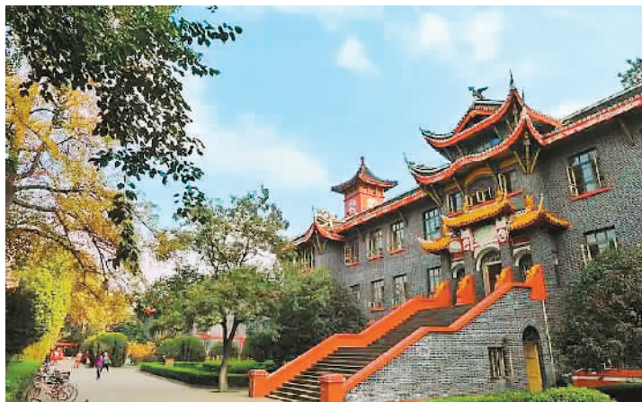
华西协和大学旧址

沿着蜿蜒的绿道，我走进四川大学华西口腔医院口腔疾病研究国家重点实验室，一位身着白大褂、知性优雅的女士，手握试管，正在绘声绘色地对课题组研究生们讲解全生命周期龋病研究前沿的课程。她的身后，是排列整齐的实验操作平台，摆满了各种现代科学仪器。