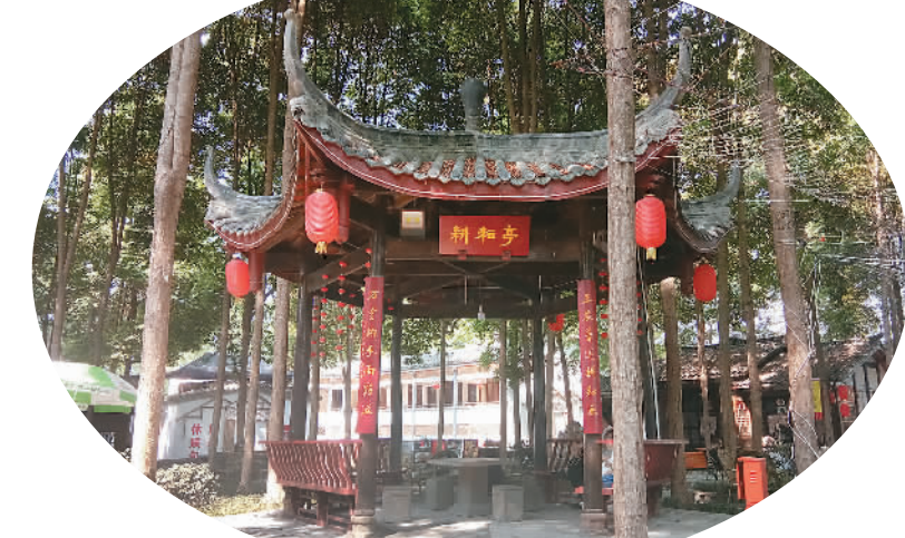
战旗村村民休闲亭。

临别时，我在一户人家门口看到这样一副对联：“柏条河畔风光好，战旗村里百家安”，横批“故园春色”。我想，“春”就在战旗村百姓的心中，在乡村愈来愈殷实富裕的美好愿景中。