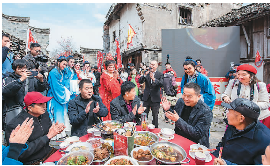
安徽省芜湖市湾沚区红杨镇西河古镇，游客与古镇居民在百家宴上同乐。

目前，中国出境游市场快速复苏，在相关政策的刺激下，潜在来华旅游需求也明显回升。《蓝皮书》指出，伴随“一带一路”沿线国家商业活动的恢复，商务旅行