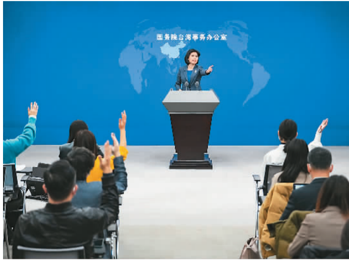
图为国台办发言人朱凤莲邀请记者提问。

朱凤莲从五方面介绍大陆有关举措：支持两岸文化界人士以弘扬中华文化为己任，合作举办交流活动，促进交流互鉴；鼓励两岸同胞开展基层人文交流，强化两岸历史联结和情感纽带；推动两岸同胞共