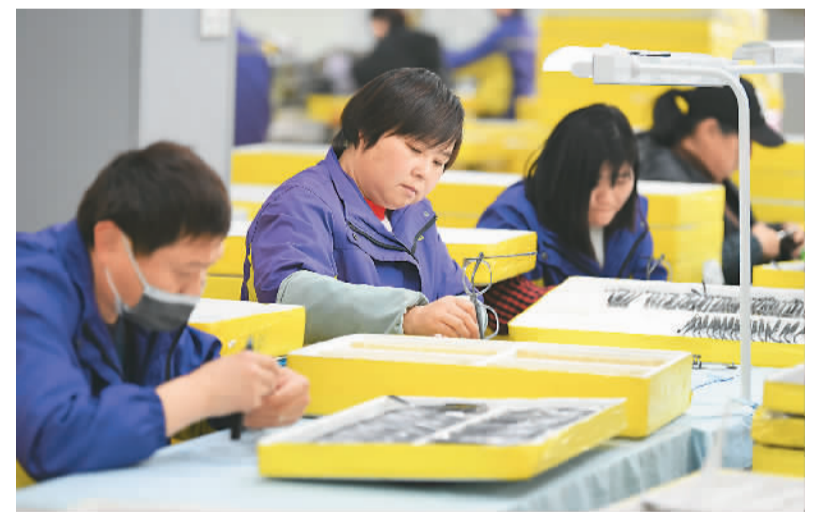
福建省福鼎市近年来不断优化营商环境，用好各项纾困惠企政策，确保减税降费政策落地见效。图为近日在港资企业巨龙光学（福建）有限公司生产车间，工人赶制海外订单产品，全力冲刺首季“开门红”。

机管局数据显示，过去12个月，香港国际机场客运量同比增加466%至760万人次，飞机起降量下跌1.7%至142920架次，货运量下跌18.2%至410万吨。