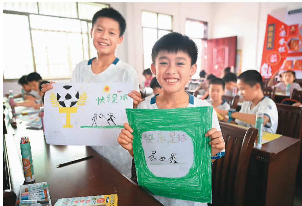
▲ 在柳江区穿山镇高平村平地屯，孩子们在室内画出他们眼中的足球梦想。