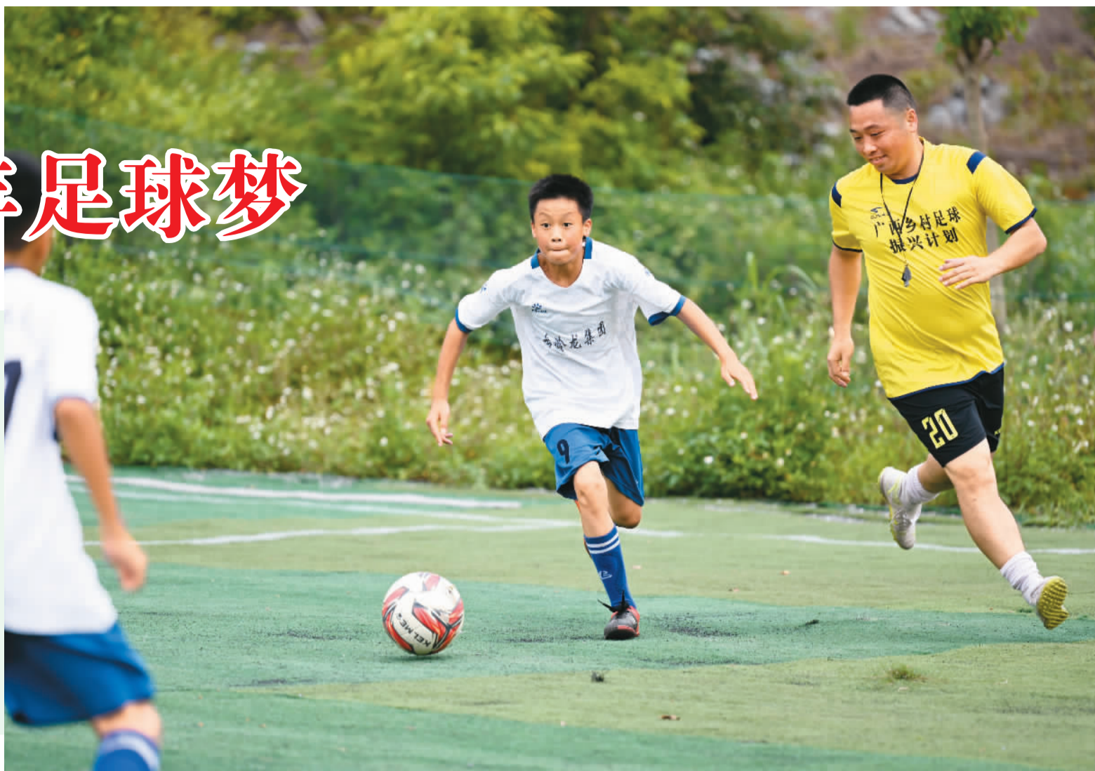
▲ 在柳江区穿山镇高平村平地屯，孩子们在公益教练的陪同下练习踢足球。

有了灯光足球场，村里的孩子们踢球更方便了，足球场已然成为乡村少年足球梦想起飞的地方。目前，柳州市柳江区已经有3个村屯建成乡村少年专属灯光足球场，7名公益教练和10多名家长教练组成的教练团队进行定期训练，吸引了100多名孩子加入。