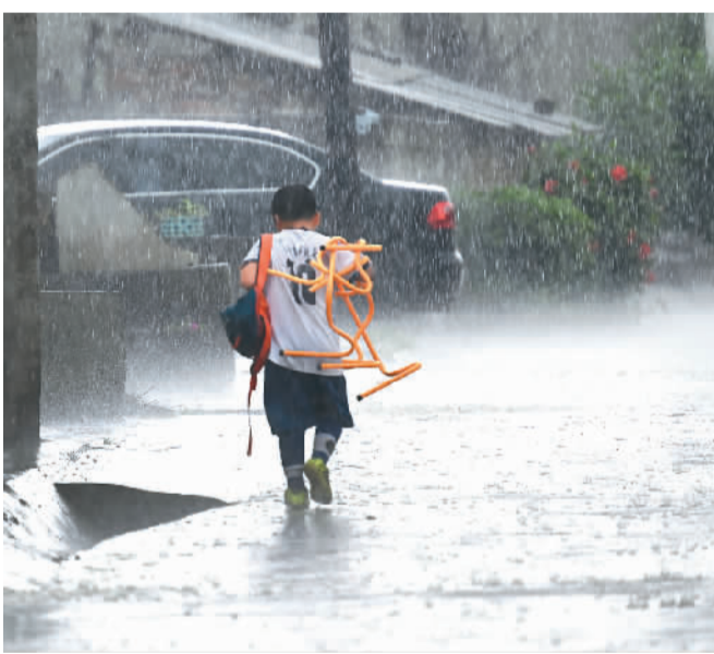
▲ 在柳江区穿山镇高平村平地屯，一名小朋友冒着大雨背训练设备回家。