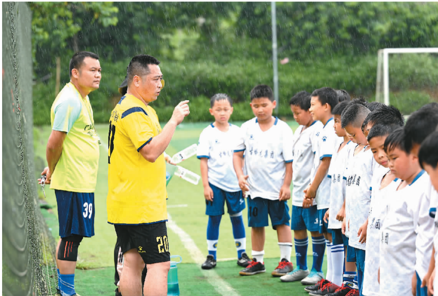
▲ 在柳江区穿山镇高平村平地屯，教练在雨中给孩子们做总结点评。