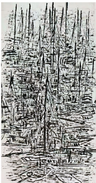
南海渔港之一（中国画）崔振宽