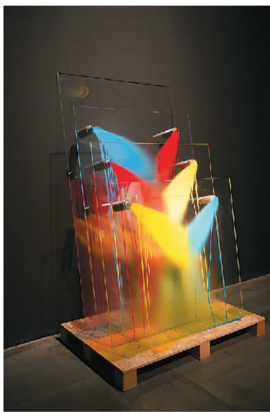
王恩来作品《解压玻璃板》。