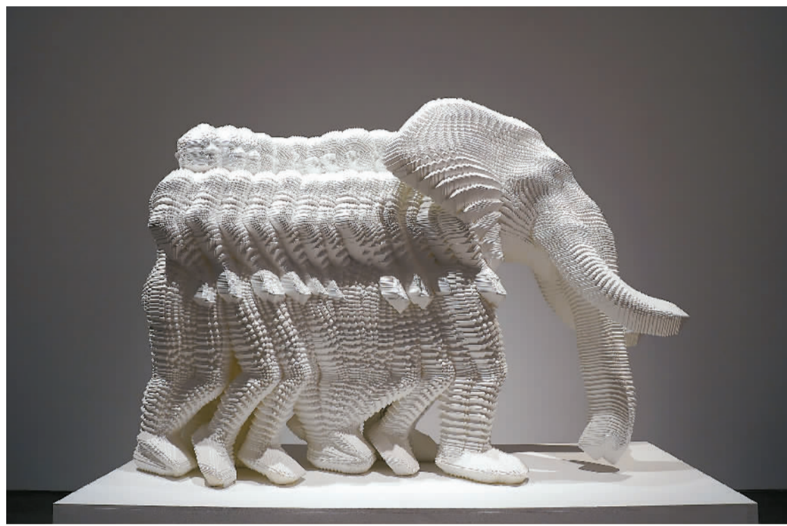
数字艺术家缪晓春的数字3D打印雕塑作品《新新大象》。

“双年展”是具有广泛国际影响力的一种大型艺术展览形式，具有开放性、时代性、创新性等特点，一般两年举办一次。由中国美术家协会、武汉市人民政府、湖北省文化和旅游厅主办的2022武汉双年展，展出285位中外艺术家及团队的446件（组）艺术作品，从2022年12月持续到2023年5月，呈现给全球观众一场精彩的艺术盛宴。