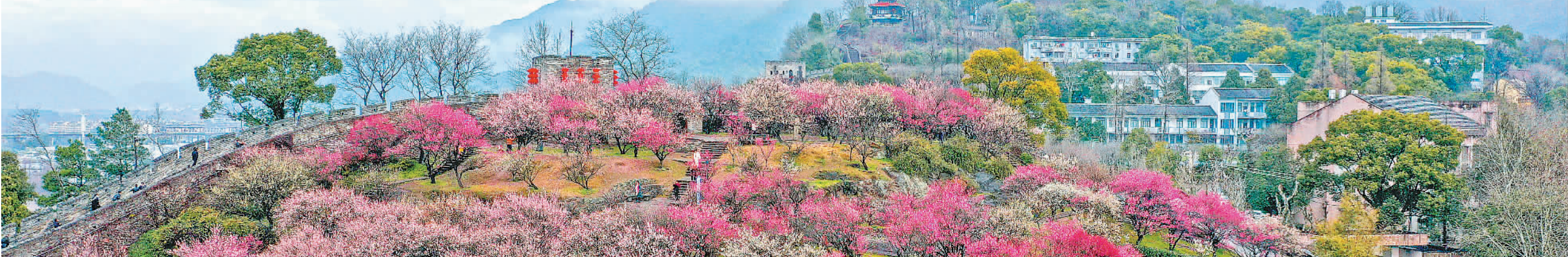
底图：浙江省临海市古城梅园风光。

此外，陕西推动产业转型升级，提升制造业重点产业链驱动力；福建推进新材料、新能源、生物与中医药等战略性新兴产业融合集群发展；上海提出大力发展数字经济、绿色低碳、元宇宙、智能终端四大新赛道……开年就开跑，奋战开门红。各地真抓实干，向“新”发力，信心满满启新程。