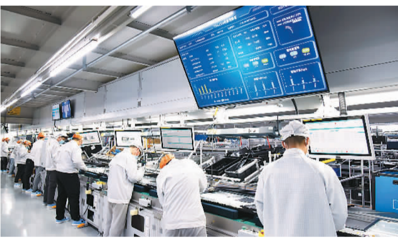
2月9日，位于山东省青岛市的海信视像科技股份有限公司青岛基地，工人加紧赶制外贸订单。

“订单多，我们提前结束假期赶回来。”1月25日，农历正月初四，位于四川省内江市的四川明泰微电子有限公司已有员工到岗。生产线