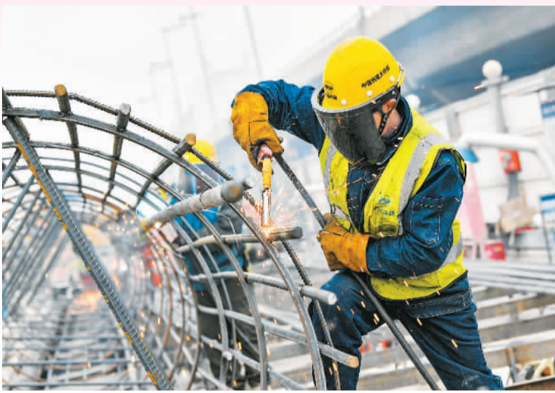
2月11日，天津地铁8号线一期工程5标项目南珠桥站施工现场，建设者进行焊接作业。

北京前门，暖阳和煦，人声鼎沸。“来，看镜头！”前门大街上，喜庆的小灯笼缀满人行道旁的树枝，大栅栏历史文化街区里的各色