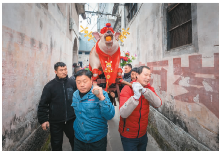
北村村民抬着“社猪”走街串巷。

“北村祭社”已历经600多年的传承，既隆重热烈，又别具一格，还喜闻乐见。它是安徽省非物质文化遗产，起初是纪念农之神社稷和表达对人寿年丰、物阜民安的憧憬和祝愿，现在已逐渐成为当地春节的一项重要民俗活动。