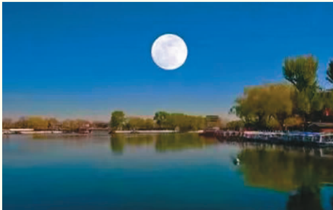
上图：后海月色。 中图：游人在银锭桥游玩。 下图：游客泛舟后海。