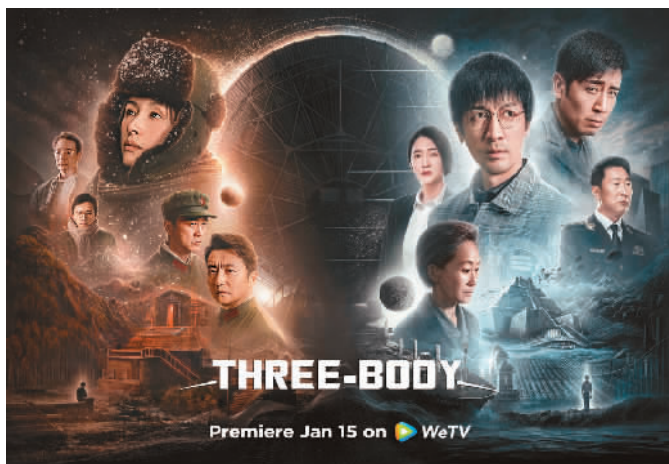
▲电视剧《三体》美国海报 出品方供图

剧自开播以来，在腾讯视频海外站WeTV、腾讯视频YouTube官方频道同步国内上线播出，反响热烈。在WeTV北美地区，《三体》每日均为站内播放量最高的内容。在YouTube平台，截至2月5日，观看人数达到409万，其中近42%的用户来自于北美地区，海外评分不断上涨，口碑持续攀升，权威评分网站IMDb评分7.8。海外观众对场景细节、特效制作、摄影风格、剧情逻辑、音乐等都给予了好评。