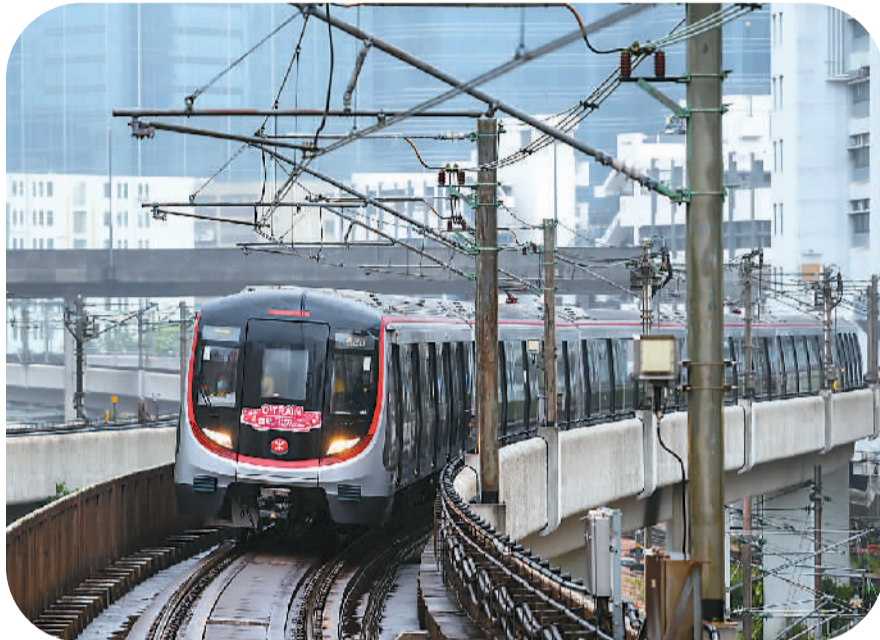
▲ 行驶中的国产新列车Q-Train。

有乘客已经留意到车厢内发生的变化：地面及座椅的紫色主调，车顶投射出明亮柔和的圆形灯光，环形把手及扶手立柱……这些都显得新上线的国产列车Q-Train看起来与众不同。