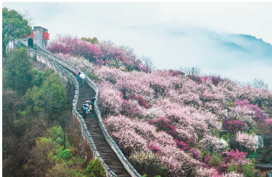
早春时节,我国南方多地春花开放,涌动着春的气息。图为市民在浙江省临海市游古城墙赏梅花。

地方对外投资活跃。2022年,地方企业对外投资939.2亿美元,较上年增长13.1%,占总额的80.4%。其中东部地区对外投资同比增长10.3%,占地方投资的81.6%,广东、浙江和上海位列地方对外投资前三位。