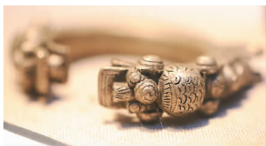
迪庆藏族龙头手镯。

自1995年建成开馆以来，云南民族博物馆以保护、弘扬民族文化为己任。馆内珍藏民族文物近5万件（套），基本陈列有“民族服饰与制作工艺”“民族文字古籍”“民族乐器”“民族民间陶艺”“民族民间面具”“民间瓦当”“民族工艺美术”“铸牢中华民族共同体意识 建设全国民族团结进步示范区——中国特色解决民族问题正确道路的云南实践”。