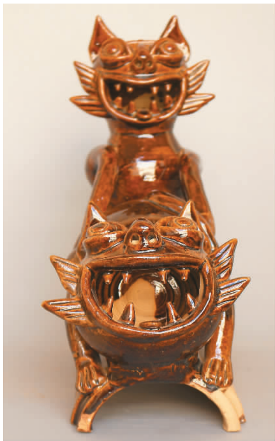
昆明汉族瓦猫夫妻猫。