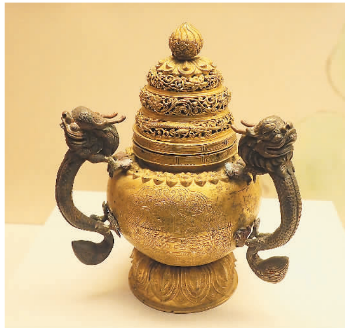
铜鎏金篆刻文字纹镂空云纹盖三龙耳覆莲座熏炉，中国国家博物馆藏。

中国科学家屠呦呦获得诺贝尔生理学或医学奖的证书和奖章尤为引人注目。屠呦呦多年从事中药和西药结合研究，创制出新型抗疟药青蒿素，可以有效降低疟疾患者的死亡率，2015年获得诺贝尔生理学或医学奖。这是中医药不断创新、造福世界人民的光辉实例。