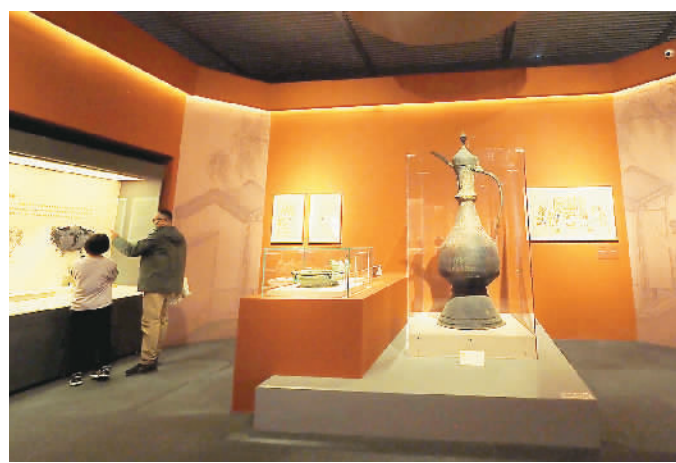
“智慧之光——中医药文化展”现场。