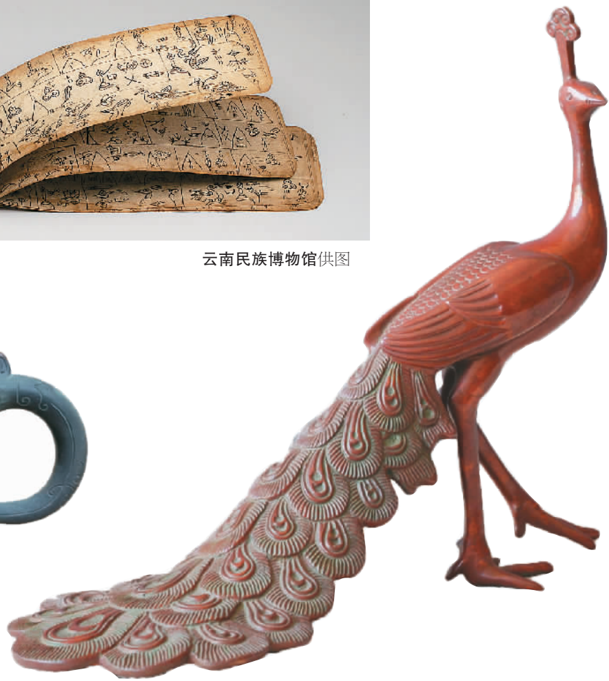
昆明汉族熟斑铜孔雀。