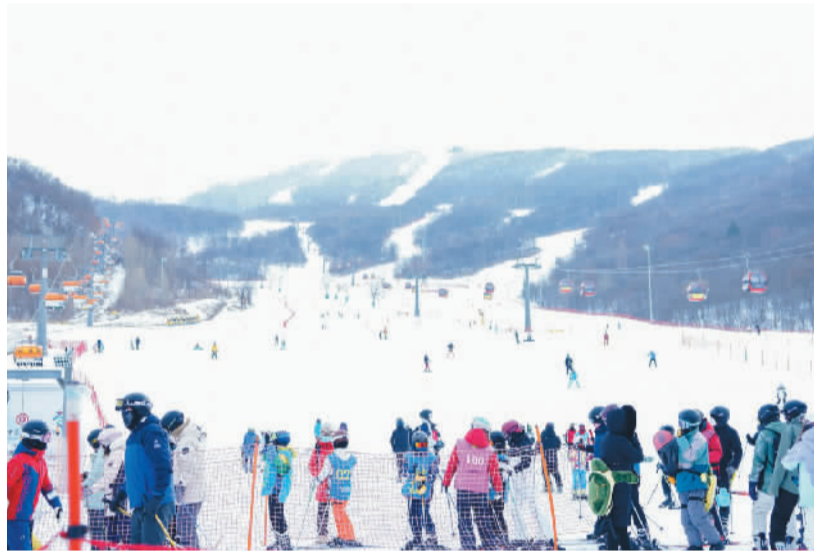
春节期间，游客在吉林省吉林市万科松花湖度假区滑雪。

北京冬奥会后的第一个雪季，大众冰雪热情加速释放，冰雪旅游市场火热。春节期间，河北崇礼、黑龙江