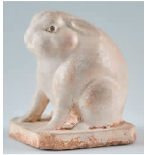
唐代白釉兔。

兔年春节到来之际，多家博物馆推出相关主题展览，如中国国家博物馆的“癸卯金安——二〇二三新春展”、上海博物馆的“玉兔精灵——上海博物馆兔年迎春展”、山西博物院的“大展宏兔——癸卯年生肖文物（图片）联展”等，通过多彩的文物，展现兔文化的丰富内涵。