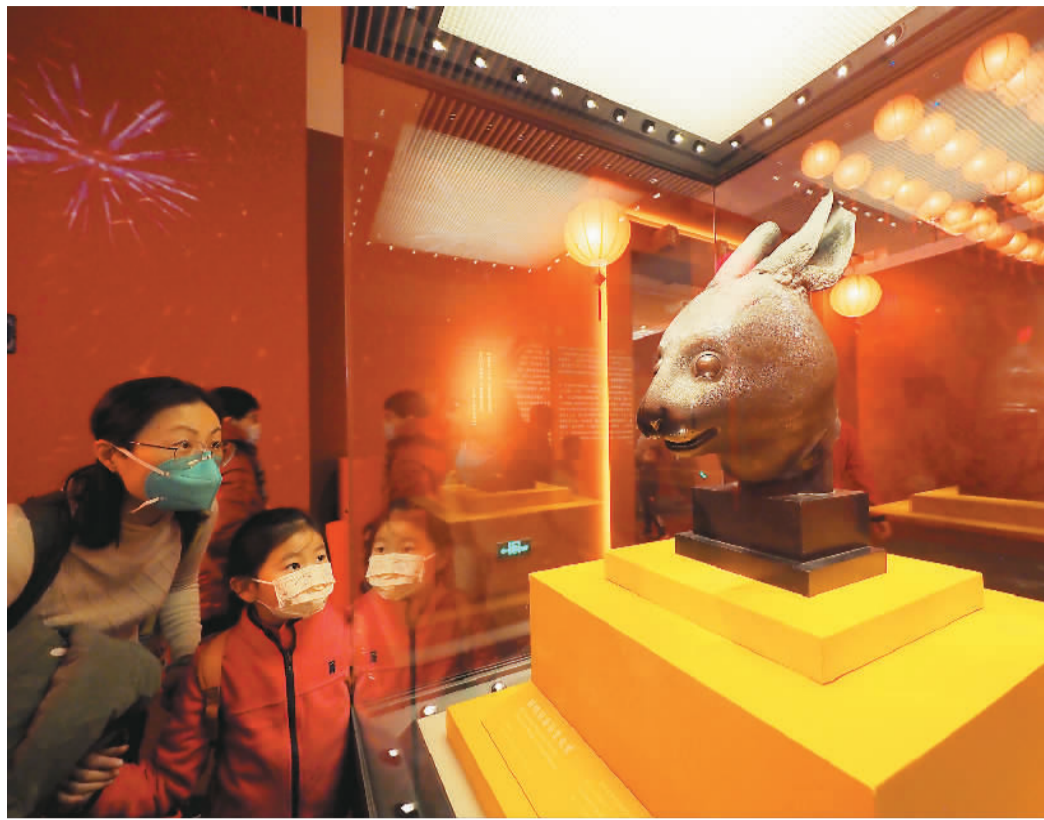
观众在中国国家博物馆“癸卯金安——二〇二三新春展”现场观赏圆明园海晏堂兔首。