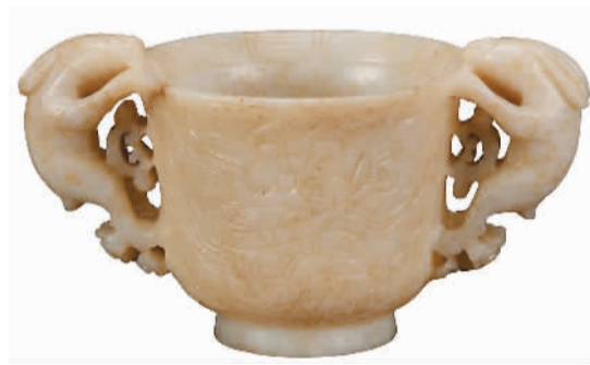
明代白玉双兔耳杯。

双耳杯一般认为是由古代羽觞发展而来，明代双耳杯继承传统，样式更为丰富。这件白玉双兔耳杯对于兔的形态把握精准，造型生动，左右呼应，工艺精湛。杯身满雕，前后阴刻四爪龙纹，是同类器物中的珍罕之作。