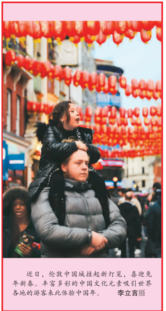
近日，伦敦中国城挂起新灯笼，喜迎兔年新春。丰富多彩的中国文化元素吸引世界各地的游客来此体验中国年。