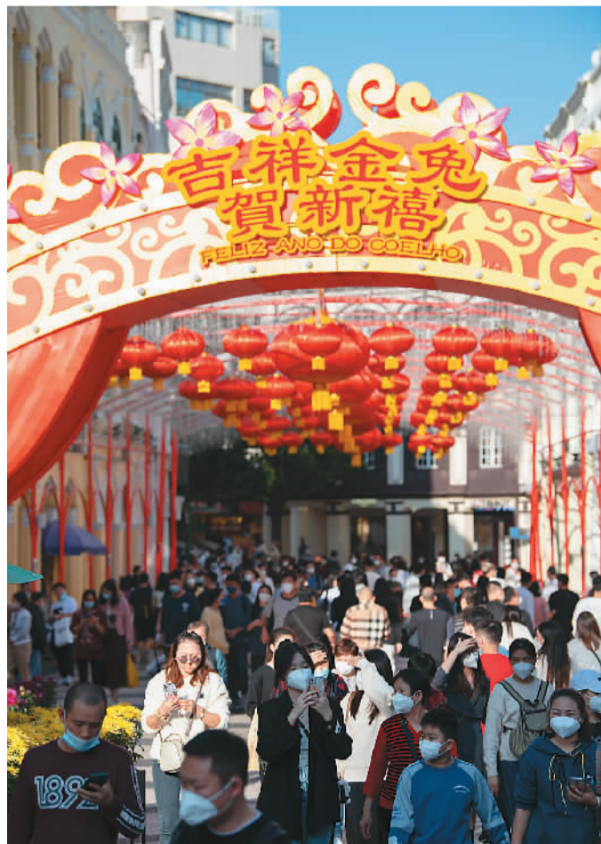
左图：游客在澳门议事亭前地游玩。右图：香港海洋公园举行“团圆贺年2023”预览活动，展示“兔跃新春”“兔跃开运牌坊”等打卡景点。图为游客在合影留恋。

则以满减、套装折扣价等方式引客。为了迎接来自内地的人流和客流，多数商家早已支持以微信、支付宝等方式进行支付。