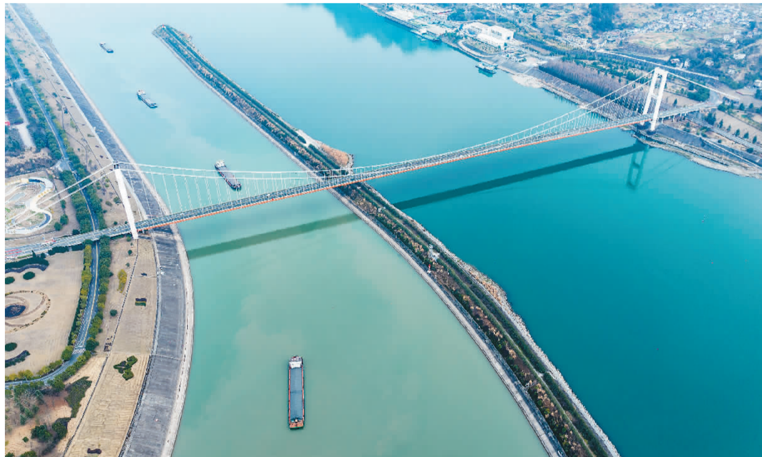
从一月十六日至十八日，长江三峡通航管理局实施三峡南北双向船闸同时运行上行闸次，确保春运期间三峡枢纽河段安全畅通稳定。图为在湖北省宜昌市，郑家裕摄(人民视觉)

中共中央政治局委员、中央统战部部长石泰峰出席座谈会。中国佛教协会、中国道教协会、中国伊斯兰教协会、中国天主教爱国会、中国基督教三自爱国运动委员会主要负责人在会上发言。