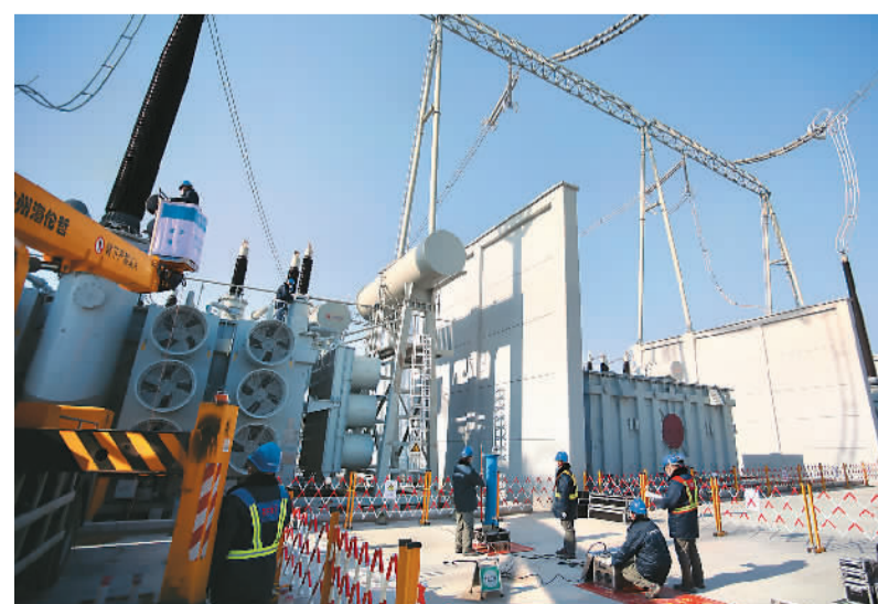
北京东1000千伏变电站是距离首都最近的特高压变电站。预计北京东扩建工程建成后增加京津冀地区600万千瓦供电能力。图为位于河北省三河市的北京东1000千伏变电站。

茶话会上，中国残疾人艺术团演员表演了精彩节目，残疾人书法家现场泼墨挥毫，书写春联和“福”字，2022北京冬奥会花束制作团队“新起点文创工作室”制作“兔爷”软陶手伴，为大家送上新春祝福。