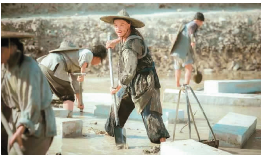
▲电视剧《天下长河》剧照。