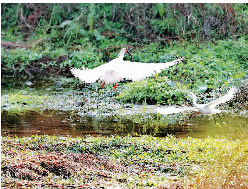
朱鹮在翠河边飞舞。