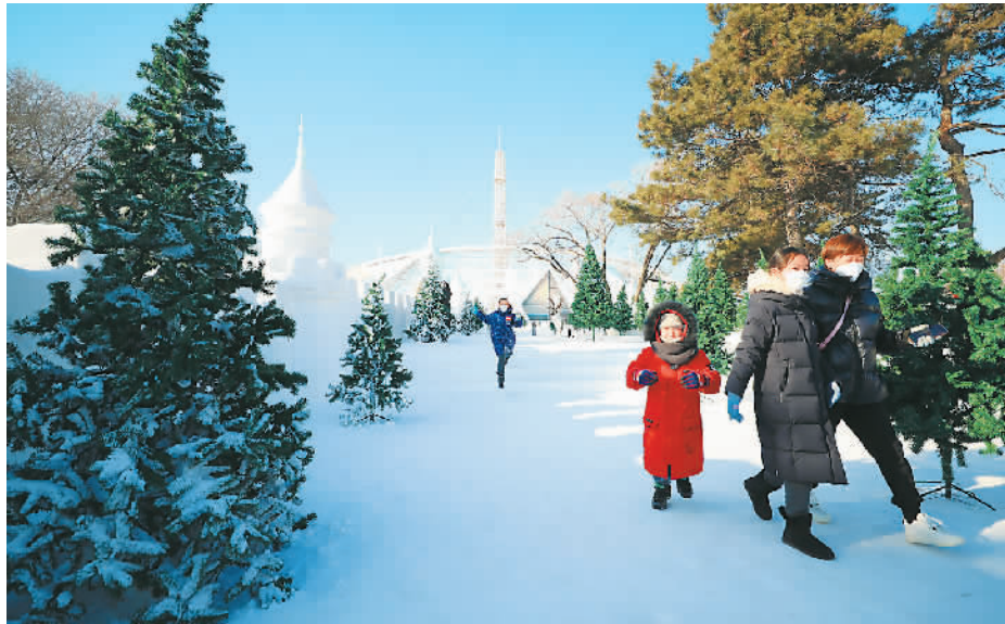
游客在沈阳世博园内游玩。

2022年12月7日，2022四川省冬季旅游启动仪式、2022四川冰雪和温泉旅游节开幕式举行，正式拉开“冬游四川”活动大幕。此次活动通过推出“冰雪+旅游”“温泉+旅游”“阳光+旅游”“体育+旅