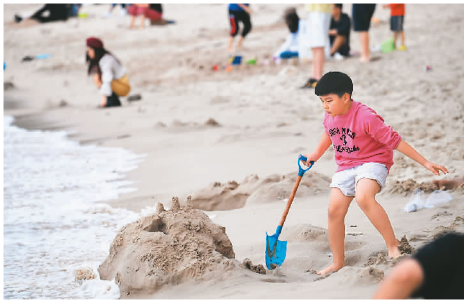
游客在三亚市大东海景区游玩。

文化和旅游部近日发布《关于组织开展第一批中国特品级旅游资源名录建设工作的通知》，明确开展中国特品级旅游资源名录建设工作，梳理好、挖掘好、开发