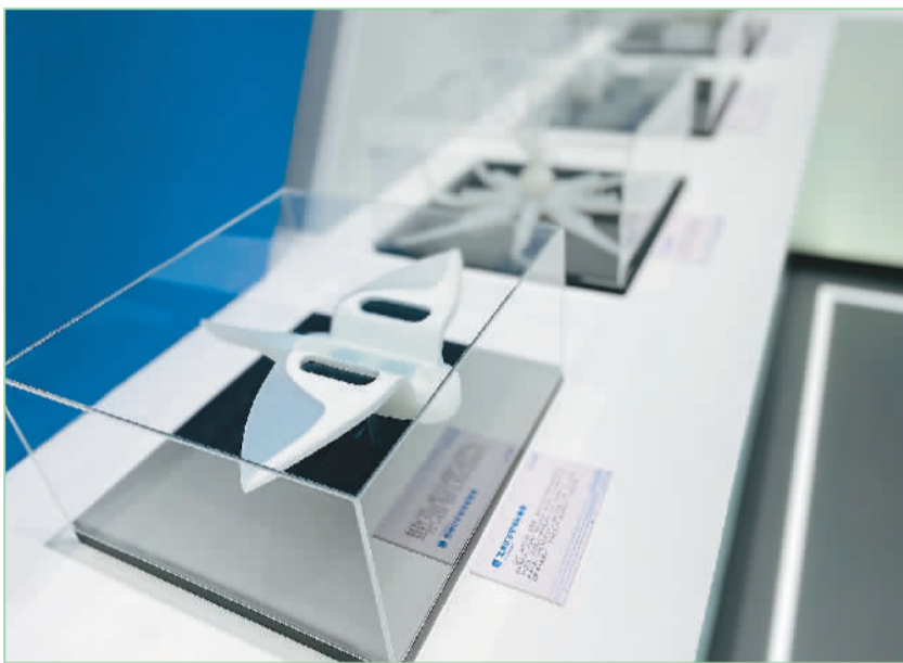
深海仿生软体机器人。

“‘尊商、亲商、安商、富商’是诸暨的优良传统，我们始终将优化营商环境放在‘C位’，聚力打造‘营商环境标杆市’。沃土之上花自开，