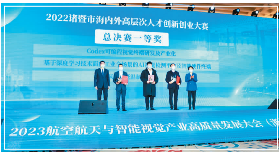
2023航空航天与智能视觉产业高质量发展大会上，同时举行了2022诸暨市海内外高层次人才创新创业大赛颁奖仪式。

1月3日上午，2023航空航天与智能视觉产业高质量发展大会在诸暨开幕，欧美同学会海归小镇（诸暨·空天装备）揭牌仪式同期举行。2022年以来，欧美同学会海归小镇频频走入公众视野，成为打造城市创新产业园区的新鲜力量。此前，海归小镇先后在杭州、无锡、长沙三地落地，诸暨则成为其落户的首个县级市。