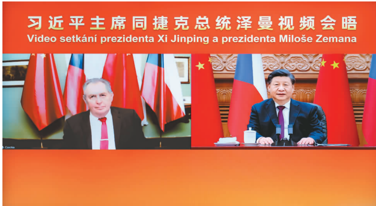
1月9日下午,国家主席习近平在北京同捷克总统泽曼举行视频会晤。

泽曼表示,我完全同意习近平主席对捷中关系的评价。我十分珍惜同习近平主席的友谊,愿同中方共同努力,加强经贸投资等领域合作,克服新冠疫情影响,恢复人员往来,使捷中关系之树枝繁叶茂,呈现勃勃生机。捷方愿为推动中欧关系健康发展发挥积极作用。王毅、何立峰等参加活动。