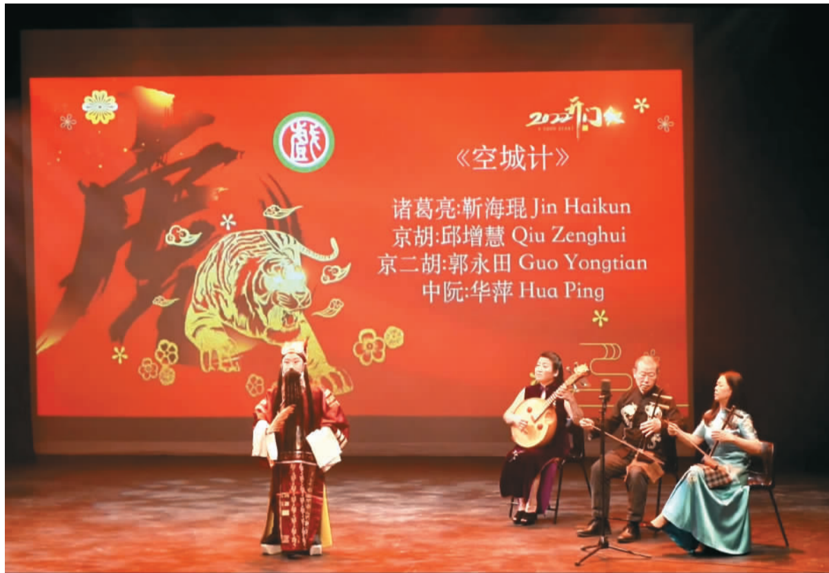
图为中英戏曲协会于英国南安普顿演出京剧《空城计》片段。

“潇洒轩昂飘逸，行云流水涌泉。”中国戏曲源远流长，底蕴深厚，具有独特文化魅力。清脆嘹亮的唱腔、行云流水的动作、引人入胜的故事，不仅吸引了众多华侨华人，也让更多的外国民众领略到中国戏曲魅力。