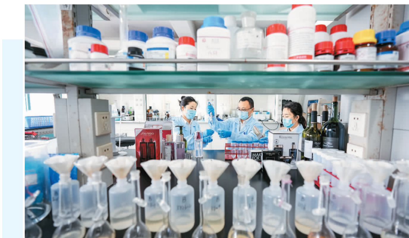
▲在海口海关技术中心，检测人员认真对免税化妆品进行实验处理。目前，针对海南离岛免税购物政策中的45大类商品主要集中在该中心检测。