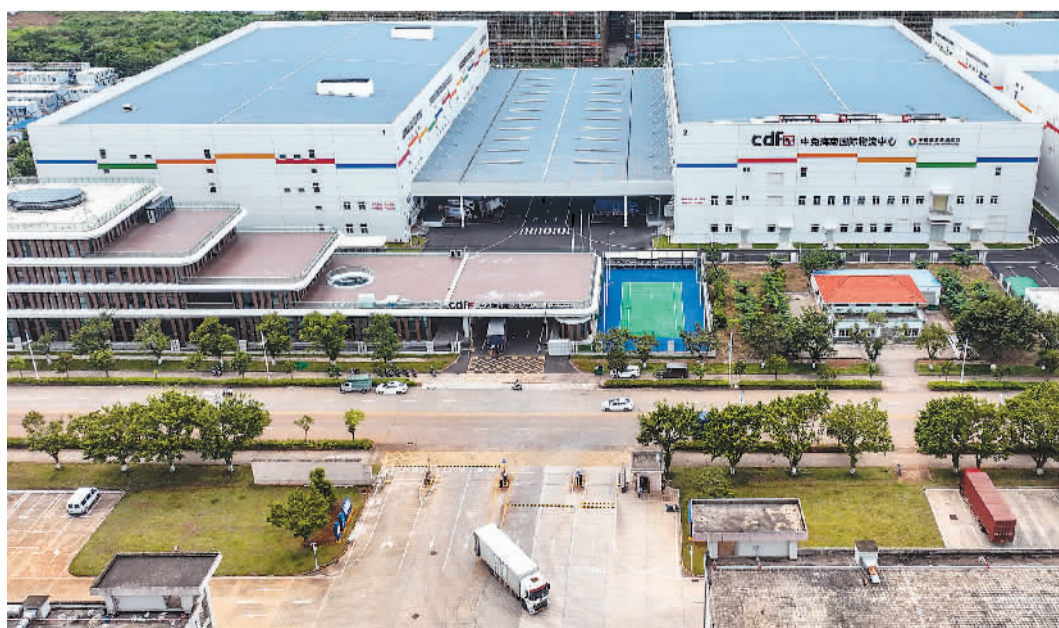
▲在位于海口综合保税区的中国中免免税品仓库，一辆货车将查验“过关”的离岛免税商品运往海口国际免税城。