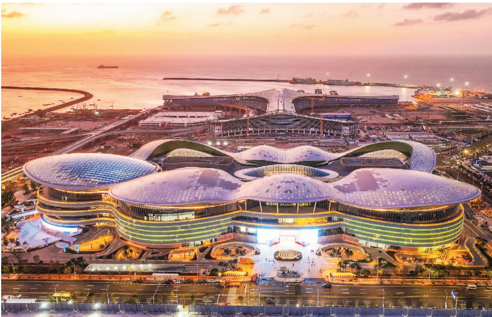
“世界最大单体免税店”海口国际免税城夜景。