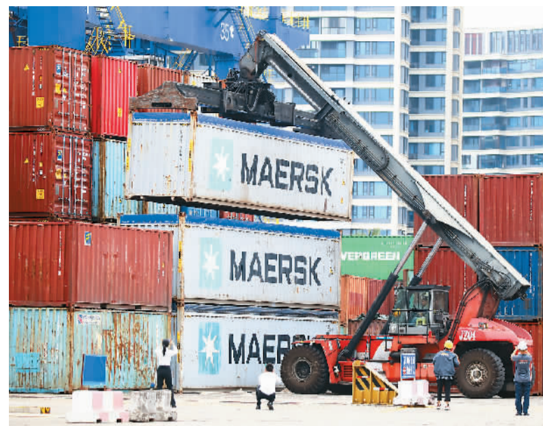
▲海南自贸港免税商品在海口港集装箱码头完成卸货，并顺利通过海口港海关查验后放行。