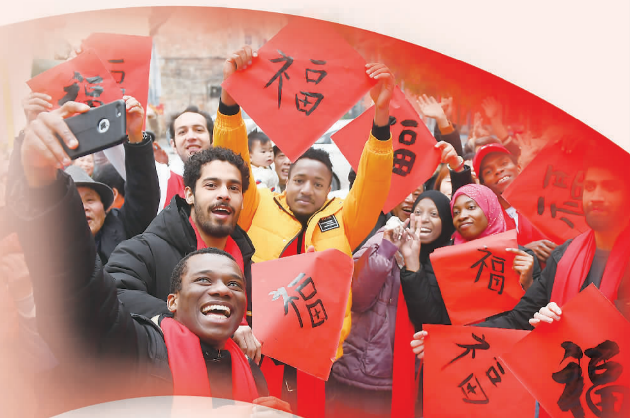
2022年春节前，江西省宜春学院的外国留学生通过写“福”字等方式，体验中国春节民俗文化。