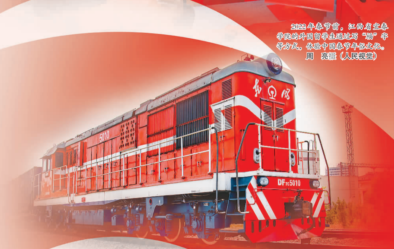
2022年11月1日，一列中欧班列从浙江省金华市启程。