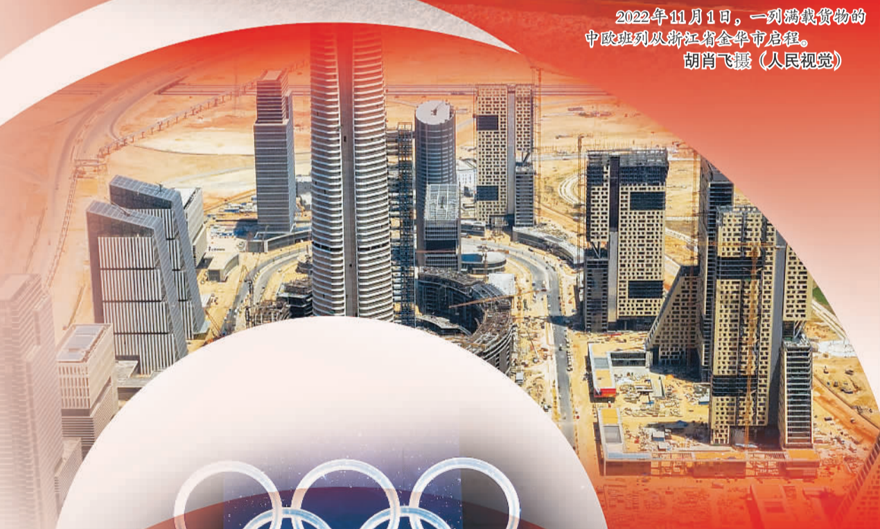
埃及新行政首都中央商务区项目。