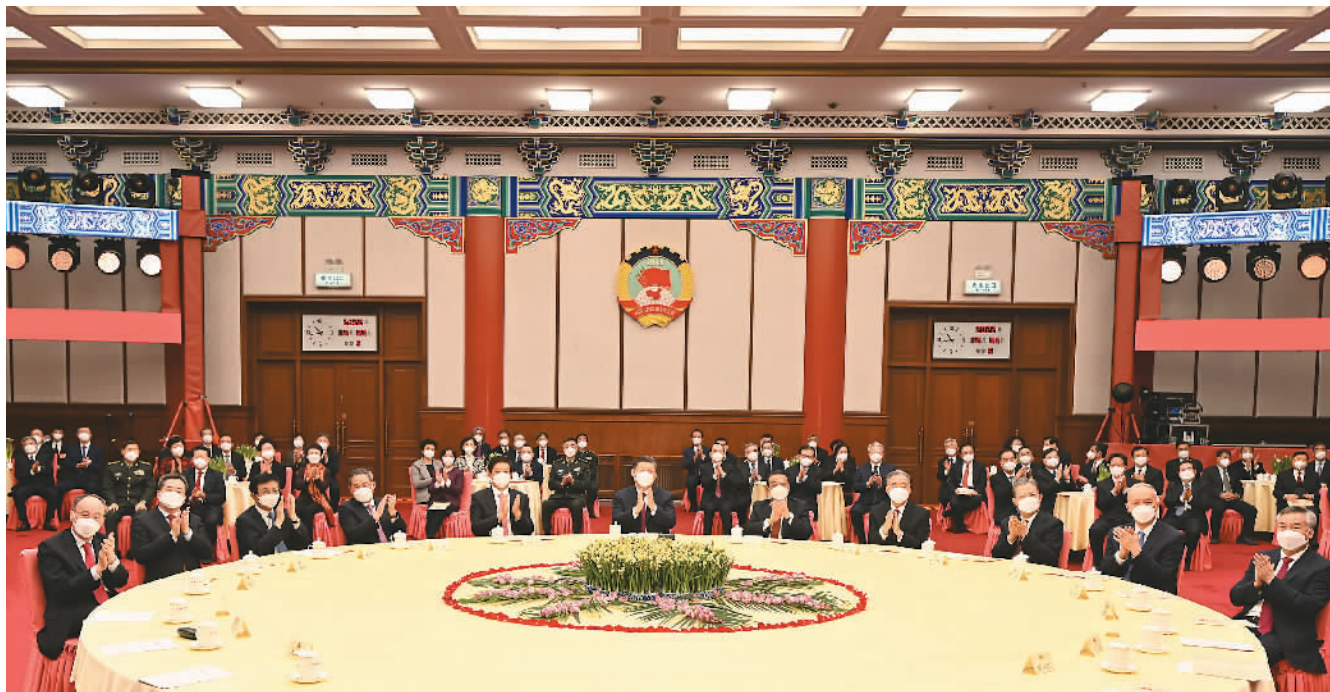
十二月三十日, 全国政协在北京举行新年茶话会。党和国家领导人习近平、李克强、栗战书、汪洋、李强、赵乐际、王沪宁、蔡奇、丁薛祥、李希、王岐山出席茶话会并观看演出。

2023年是全面贯彻落实党的二十大精神开局之年。开局关乎全局,起步决定后程。我们要以斗争精神迎接挑战,以奋进拼搏开辟未来,努力实现全年目标任务,为实现第二个百年奋斗目标奠定良好基础