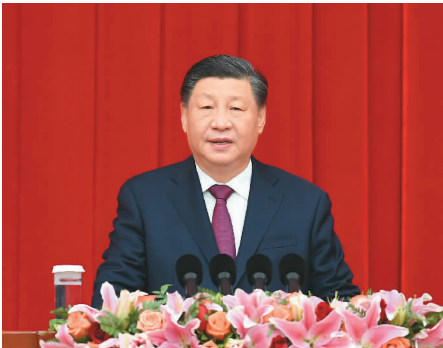
十二月三十日, 全国政协在北京举行新年茶话会。中共中央总书记、国家主席、中央军委主席习近平在茶话会上发表重要讲话。