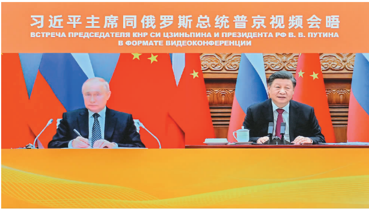
十二月三十日下午, 国家主席习近平在北京同俄罗斯总统普京举行视频会晤。

新华社北京12月30日电 12月30日下午, 国家主席习近平在北京同俄罗斯总统普京举行视频会晤。