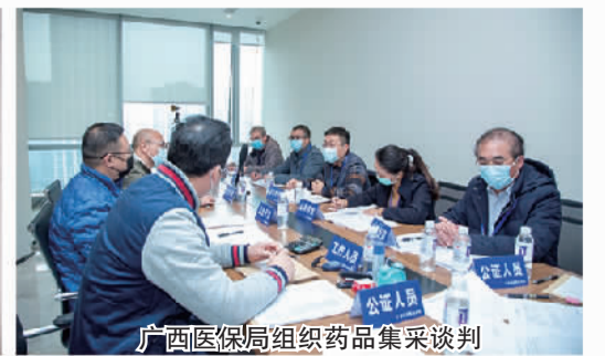
广西医保局组织药品集采谈判