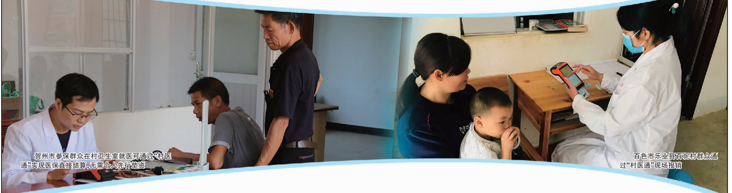
贺州市参保群众在村卫生室就医可通过“村医通”实现医保直接结算，无需个人先行垫资