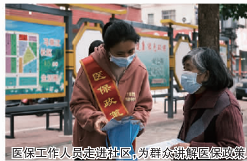
医保工作人员走进社区，为群众讲解医保政策