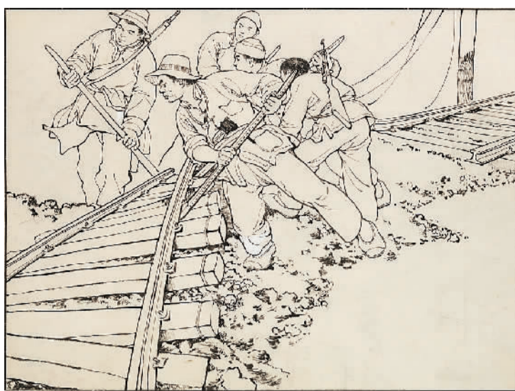
▲铁道游击队(连环画) ▲黄河(连环画)