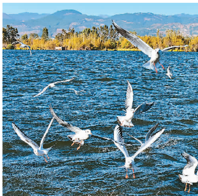
左图：红嘴鸥在水面嬉戏。

艳阳高照的一天，我和几位朋友来到了四川省西昌市邛海湿地公园湖畔。只见沿途沙滩干净整洁，湖水清澈如镜，给人以美的享受。