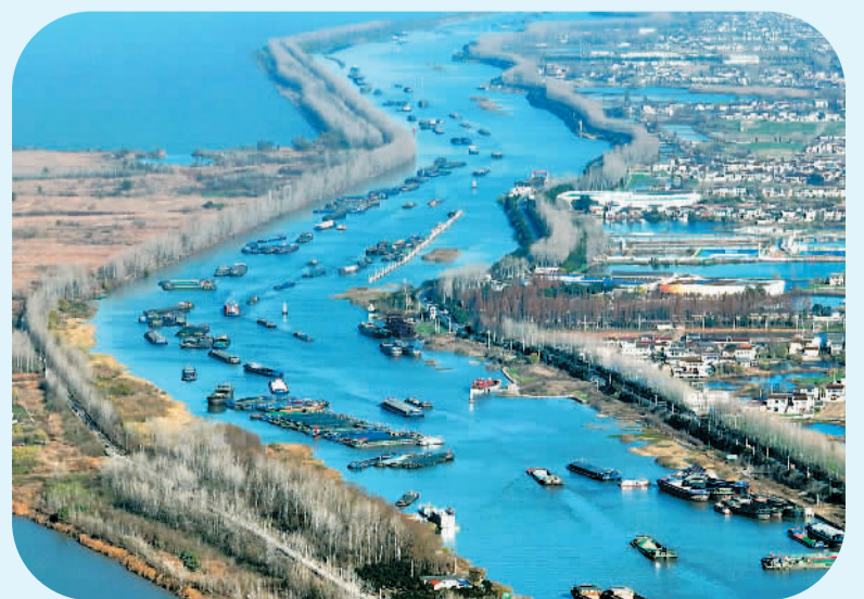
进入冬季，多地煤炭等物资需求增加，素有“黄金水道”之称的京杭大运河上船只来往如梭，一艘艘装载煤炭、钢材、建材等货物的船舶在航道上有序航行，呈现一派繁忙景象。图为12月18日，货船行驶在京杭大运河江苏扬州段。