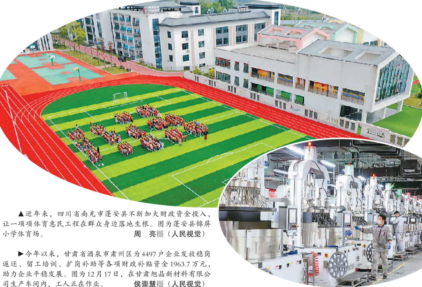
▲近年来，四川省南充市蓬安县不断加大财政资金投入，让一项项惠民工程在群众身边落地生根。图为蓬安县锦屏小学体育场。

财政部有关负责人表示，2022年特别国债发行采用市场化方式，严格按照相关法律法规，在全国银行间债券市场面向有关银行定向发行，发行过程不涉及社会投资者，个人不能购买，“2022年特别国债是2007年特别国债的等额滚动发行，仍与原有资产负债相对应，不会增加财政赤字”。