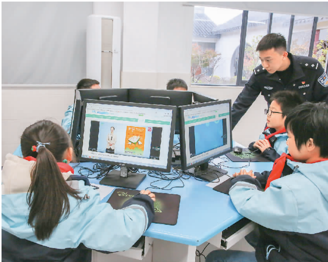
在江苏省如皋市丁堰镇刘海小学内,民警引导学生文明上网,远离和抵制有害信息。

“未成年人近半年内的上网率达99.9%,明显高于全国互联网普及率(73%)”。这是中国社会科学院新闻与传播研究所、社会科学文献出版社日前发布的《青少年蓝皮书:中国未成年人互联网运用报告(2022)》中显示的抽样调查数据。互联网已经成为未成年人不可或缺的学习和生活工具,未成年人健康使用互联网关系到家庭的幸福和社会的稳定。怎样构建良好的互联网生态环境,确保未成年人健康上网?