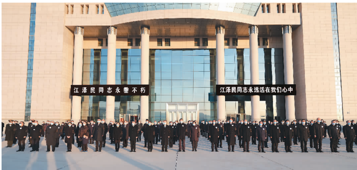
12月1日,江泽民同志的遗体从上海由专机敬移到达北京。习近平、李克强、栗战书、汪洋、李强、赵乐际、王沪宁、韩正、丁薛祥、李希、王岐山等党和国家领导同志到北京西郊机场迎灵。蔡奇等从上海护送江泽民同志遗体回到北京。

新华社北京12月1日电 我党我军我国各族人民公认的享有崇高威望的卓越领导人,伟大的马克思主义者,伟大的无产阶级革命家、政治家、军事家、外交家,久经考验的共产主义战士,中国特色社会主义伟大事业的杰出领导者,党的第三代中央领导集体的核心,“三个代表”重要思想的主要创立者江泽民同志的遗体今天从上海由专机敬移到达北京。习近平、李克强、栗战书、汪洋、李强、赵乐际、王沪宁、韩正、丁薛祥、李希、王岐山等党和国家领导同志到北京西郊机场迎灵,并向江泽民同志亲属表示深切慰问。蔡奇和治丧委员会办公室有关同志、江泽民同志亲属从上海护送江泽民同志遗体回到北京。