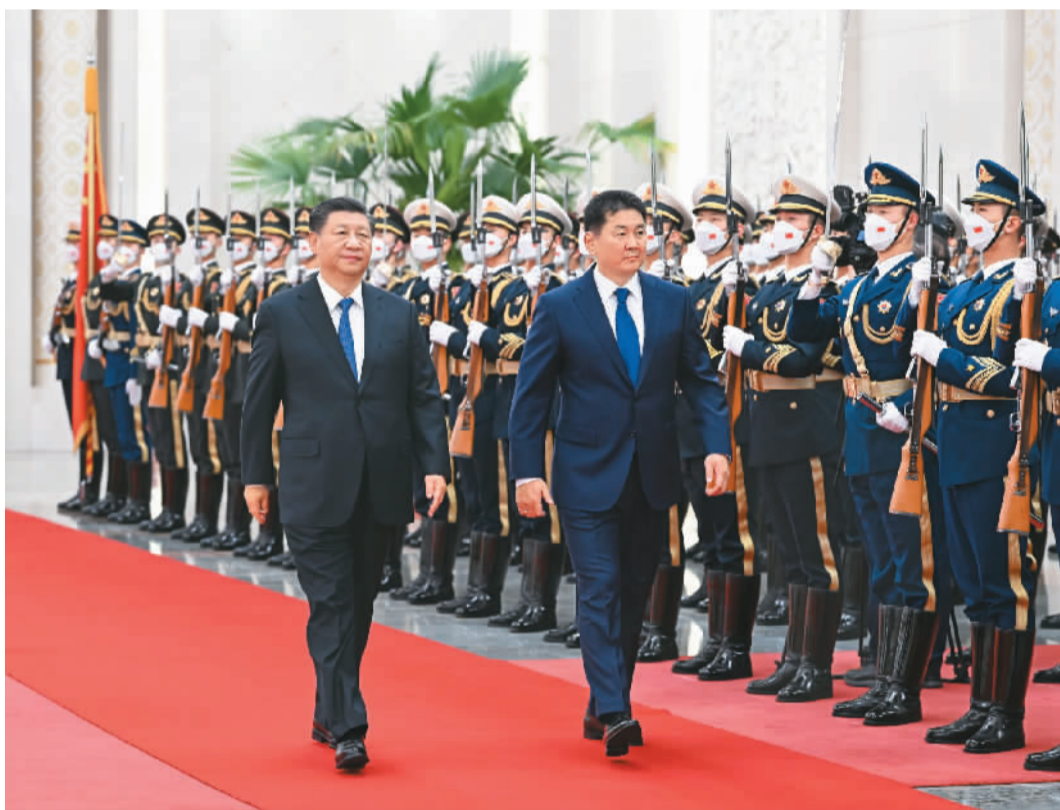
十一月二十八日,国家主席习近平在北京人民大会堂同来华进行国事访问的蒙古国总统呼日勒苏赫举行会谈。这是会谈前,习近平在人民大会堂北大厅为呼日勒苏赫举行欢迎仪式。

新华社北京11月28日电 11月28日下午,国家主席习近平在人民大会堂同来华进行国事访问的蒙古国总统呼日勒苏赫举行会谈。