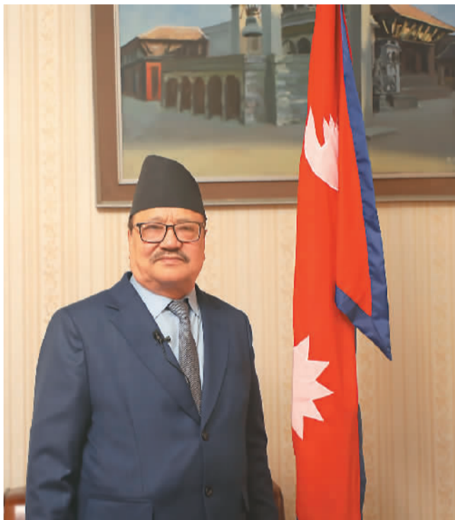
尼泊尔驻华大使比什努·施雷斯塔近照。海外网 陆宇远摄