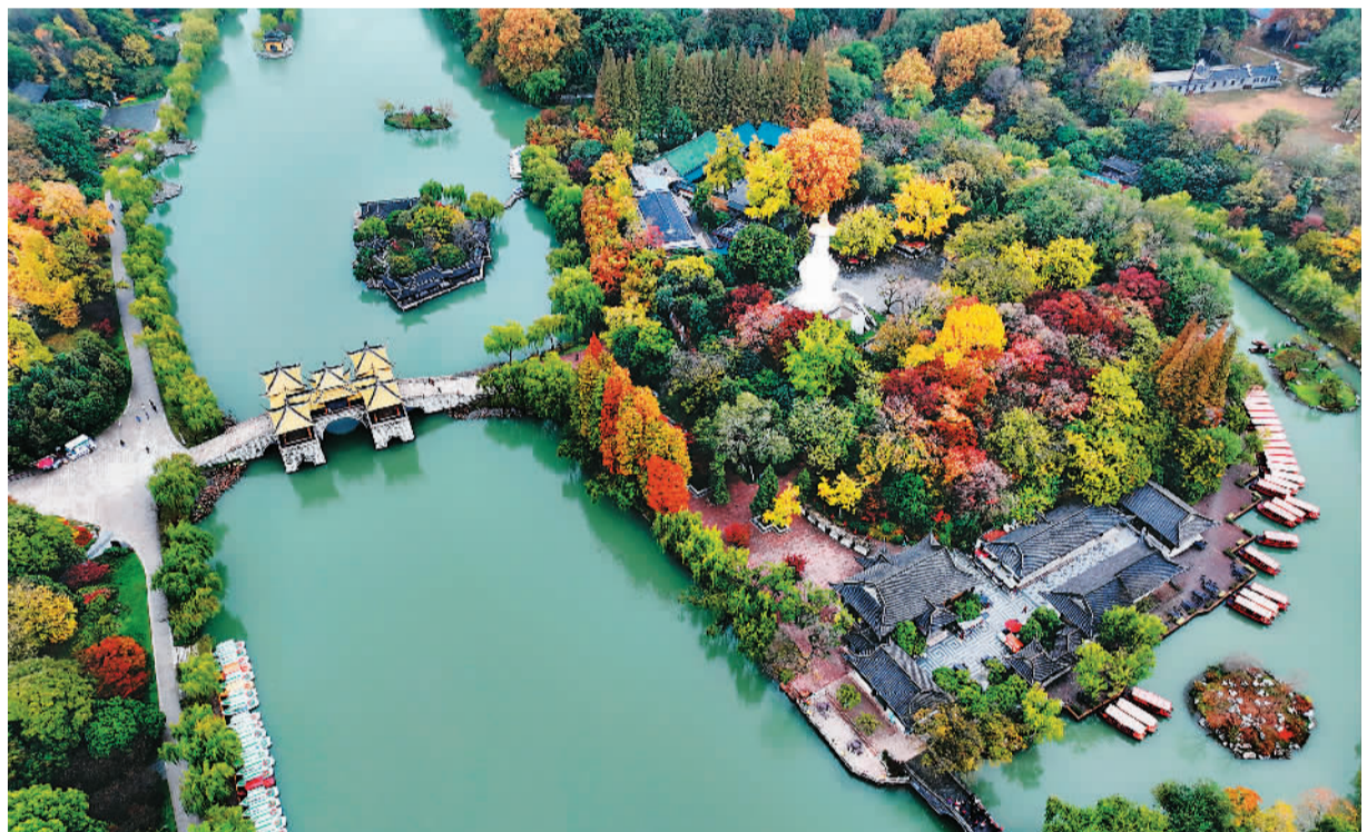
初冬时节，我国南方部分地区迎来彩叶观赏佳期，色彩斑斓的各色树叶美如画卷。图为11月19日拍摄的江苏扬州瘦西湖风景区初冬景色。