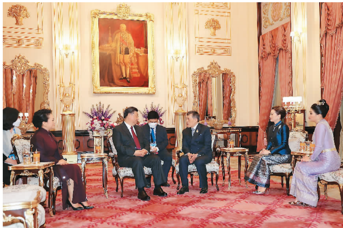
当地时间十一月十八日晚, 国家主席习近平和夫人彭丽媛在曼谷大王宫会见泰国国王哇集拉隆功和王后素提达。

球发展倡议落地落实, 共同开创更加繁荣美好的未来。第6届中国—南亚博览会当日在云南省昆明市开幕, 主题为“共享新机遇, 共谋新发展”, 由商务部和云南省人民政府共同主办。