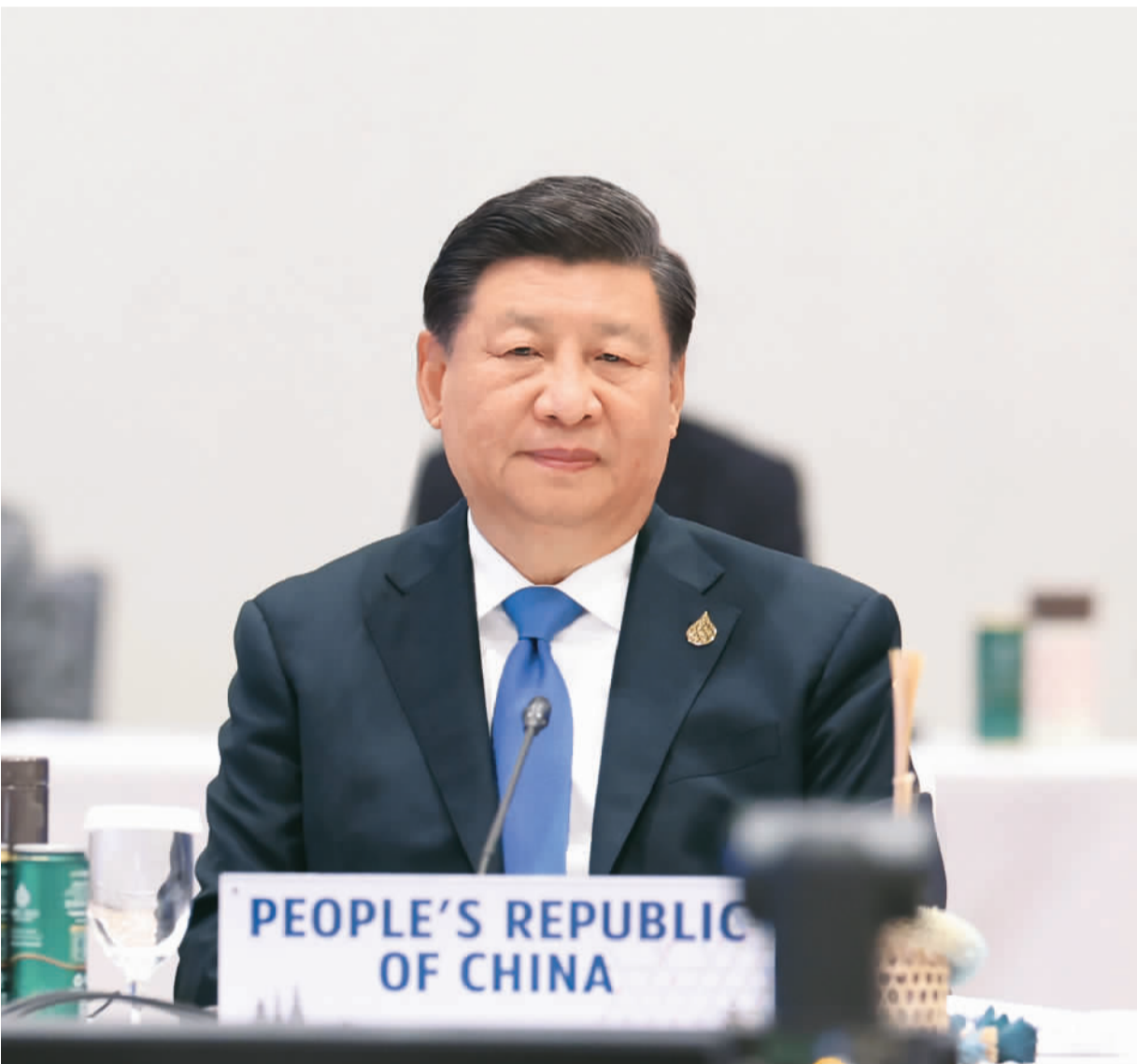
当地时间11月19日上午, 国家主席习近平在泰国曼谷继续出席亚太经合组织第二十九次领导人非正式会议。