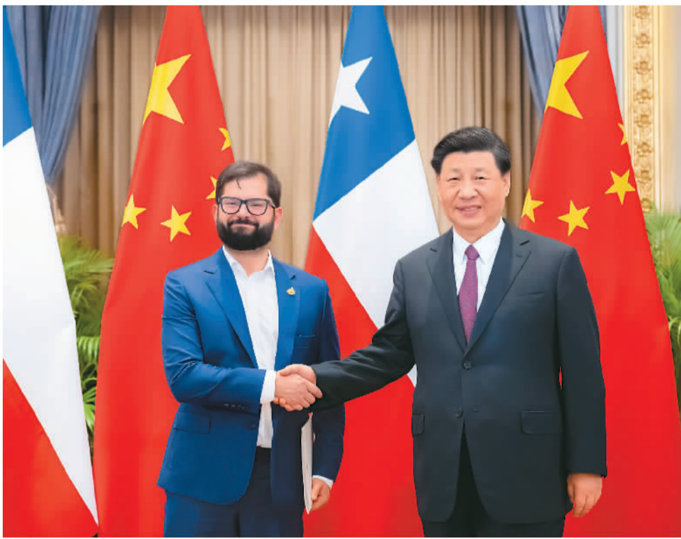
当地时间11月18日下午，国家主席习近平在泰国曼谷会见智利总统博里奇。

冠肺炎疫苗，感谢中方给予文方担任东盟轮值主席国工作大力支持。文方坚定奉行一个中国政策，愿同中方推动文关系中关系更上一层楼，欢迎中方积极参与文莱经济多元化进程，加强经贸、教育、人文、体育、防务等领域交流合作。文方愿为推进东盟同中国全面战略合作伙伴关系发挥积极作用。丁薛祥、王毅、何立峰等参加会见。