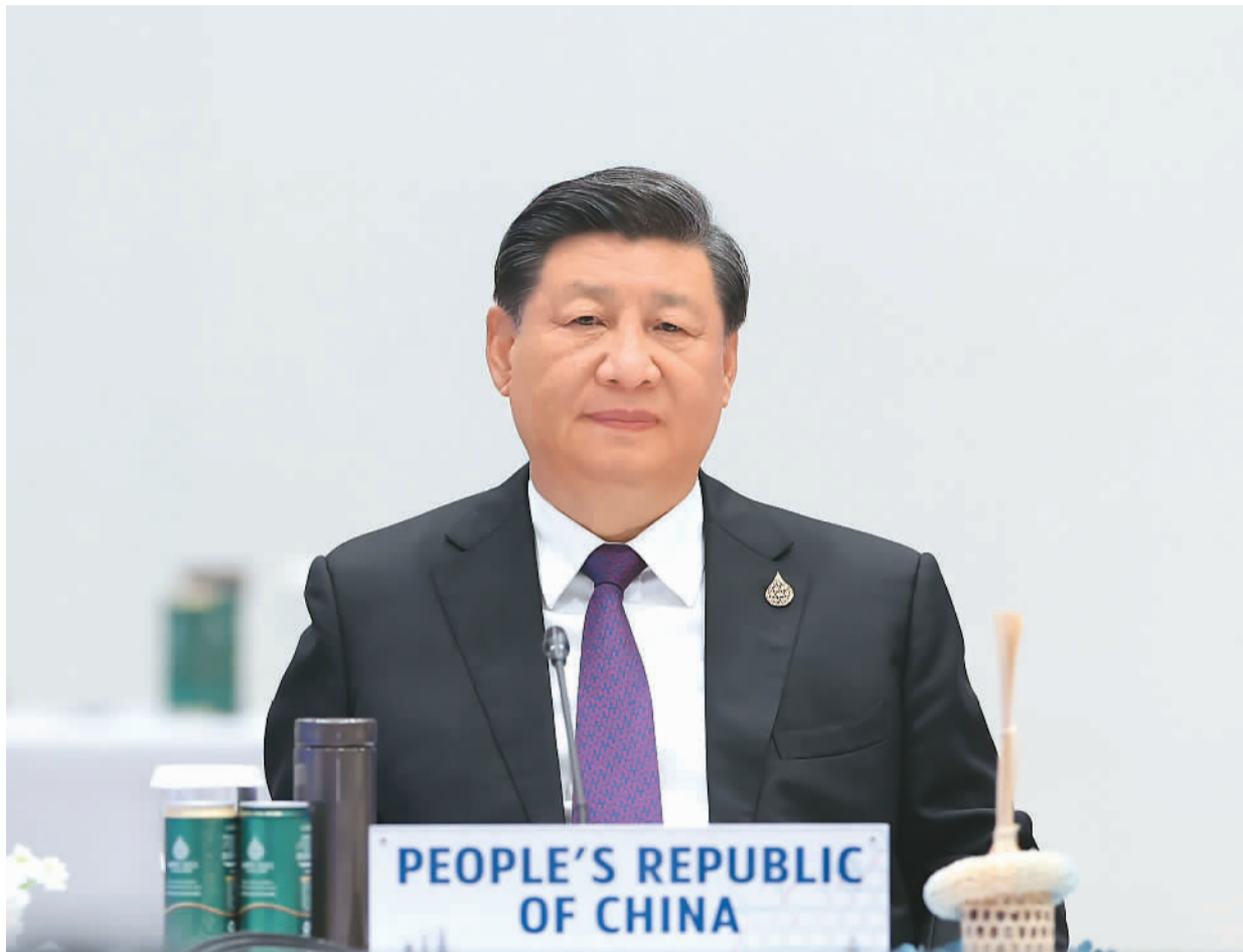
当地时间11月18日上午，亚太经合组织第二十九次领导人非正式会议在泰国曼谷国家会议中心举行。国家主席习近平出席会议并发表题为《团结合作勇担责任 构建亚太命运共同体》的重要讲话。

■ 上个月，中国共产党第二十次全国代表大会成功举行，为当前和今后一个时期中国发展指明了方向、规划了蓝图。中国愿同所有国家在相互尊重、平等互利的基础上和平共处、共同发展。中国将坚持实施更大范围、更宽领域、更深层次对外开放，坚持走中国式现代化道路，建设更高水平开放型经济新体制，继续同世界特别是亚太分享中国发展的机遇