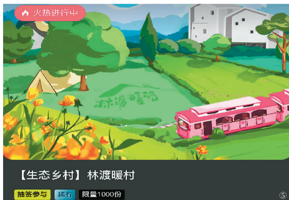
【生态乡村】林渡暖村