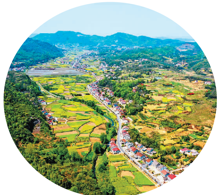
下图：湖南省澧县码头镇风光。

与此同时，澧县部分村通过党员干部牵头创办合作社，鼓励群众投资入股，构建“支部领航、党员带头、群众参与”的村级集体经济发展新格局。2019年6月，澧西街道向阳村干部自筹资金110余万元，创办人造花画品制造厂，解决了