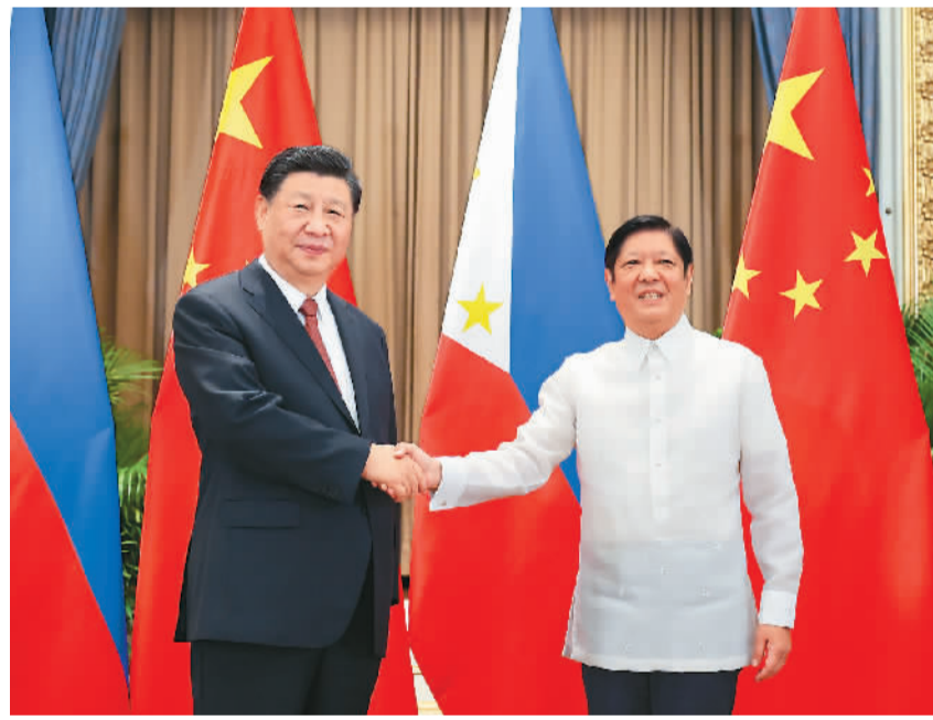
当地时间11月17日下午,国家主席习近平在泰国曼谷会见菲律宾总统马科斯。