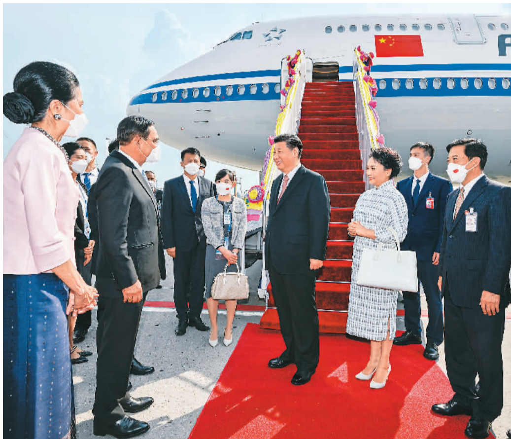
当地时间十一月十七日下午,国家主席习近平乘专机抵达泰国曼谷,出席亚太经合组织第二十九次领导人非正式会议并对泰国进行访问。这是习近平和夫人彭丽媛乘坐的专机抵达曼谷素万那普国际机场时,泰国总理巴育夫妇、副总理兼外长敦夫妇、文化部部长伊提蓬夫妇等热情迎接。