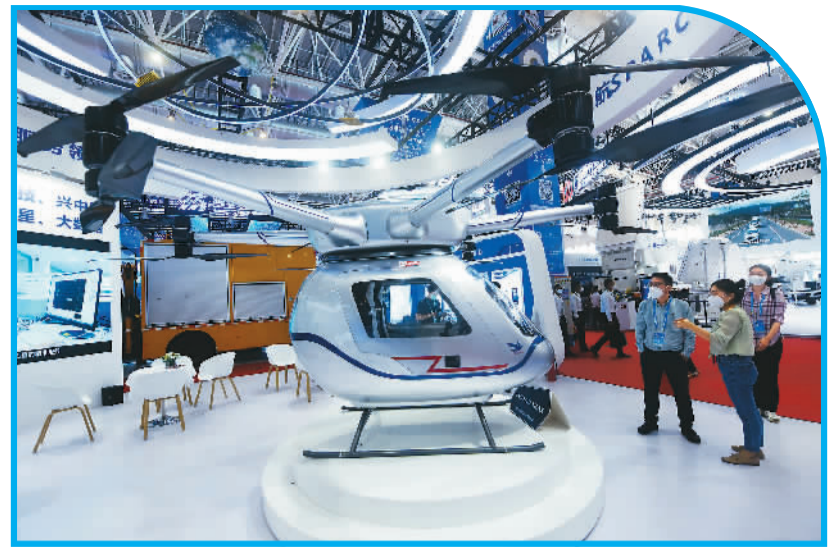
11月10日，观众在中国航展上观看一款飞行汽车（自动载人飞行器）。