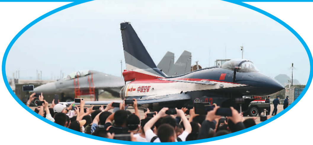
左图：11月12日，在中国航展现场，观众拍照留念。

“三兄弟”比翼齐飞也成为现实。运油-20、C919、AG600先后展翅蓝天进行飞行表演，首次共舞在中国航展的蓝天之上。