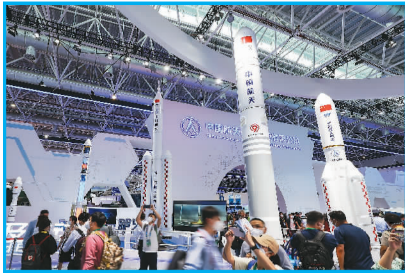
11月9日，中国新一代运载火箭模型亮相中国航展。