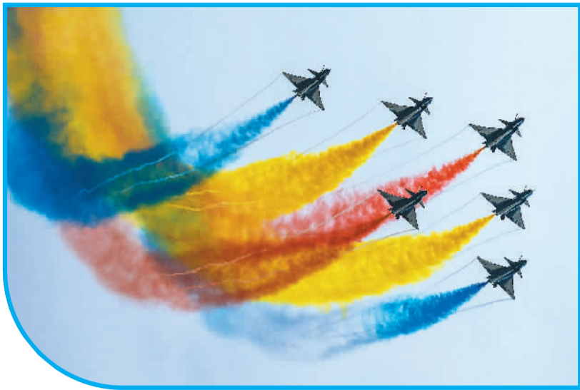
11月8日，中国空军八一飞行表演队在中国航展进行飞行表演。