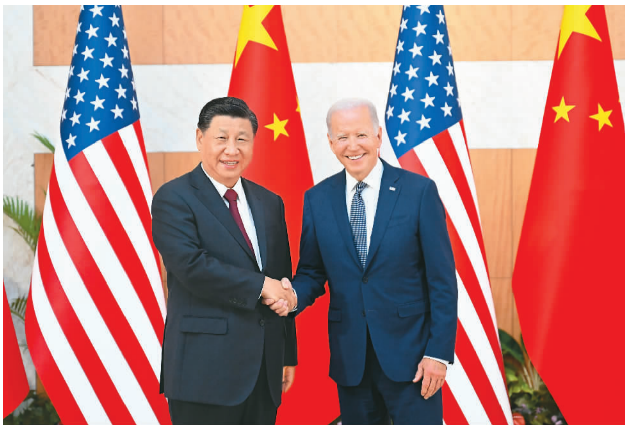
当地时间11月14日下午, 国家主席习近平在印度尼西亚巴厘岛同美国总统拜登举行会晤。