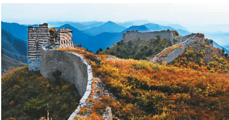
白羊峪长城。

长城在河北省唐山市绵延228.4公里，穿越了遵化、迁西、迁安三县（市）。该段长城保存比较完好，整体连贯，精