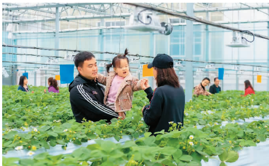
游客在盐城市盐都区现代农业产业示范园草莓大棚内游玩。

目前，盐都休闲农业与乡村旅游综合发展实力已跻身全国50强，获评“江苏生态休闲度假旅游示范区”、“最美中国·全域旅游创建示范城市”、“最美中国·全国旅游创新发展示范区”和“上海旅游资源推广卓越能力奖”。