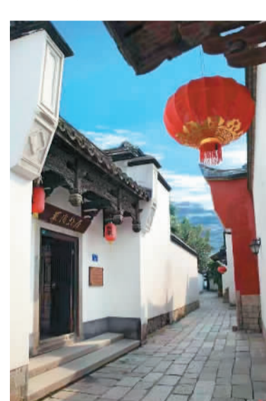
三坊七巷中的名人故居。

走出严复故居，遇到主办单位负责人，要我们穿过文儒巷到通湖路上车返回旅邸。在巷内，又看到了林则徐母家故居、清代有“父子四进士，兄弟六科甲”美称的陈承裘故居等。在这些复原得十分完整的建筑旁的小巷，我也看到了许多破败的小屋，想想，这悠悠岁月筛选下来的土地，也有幸与不幸啊！