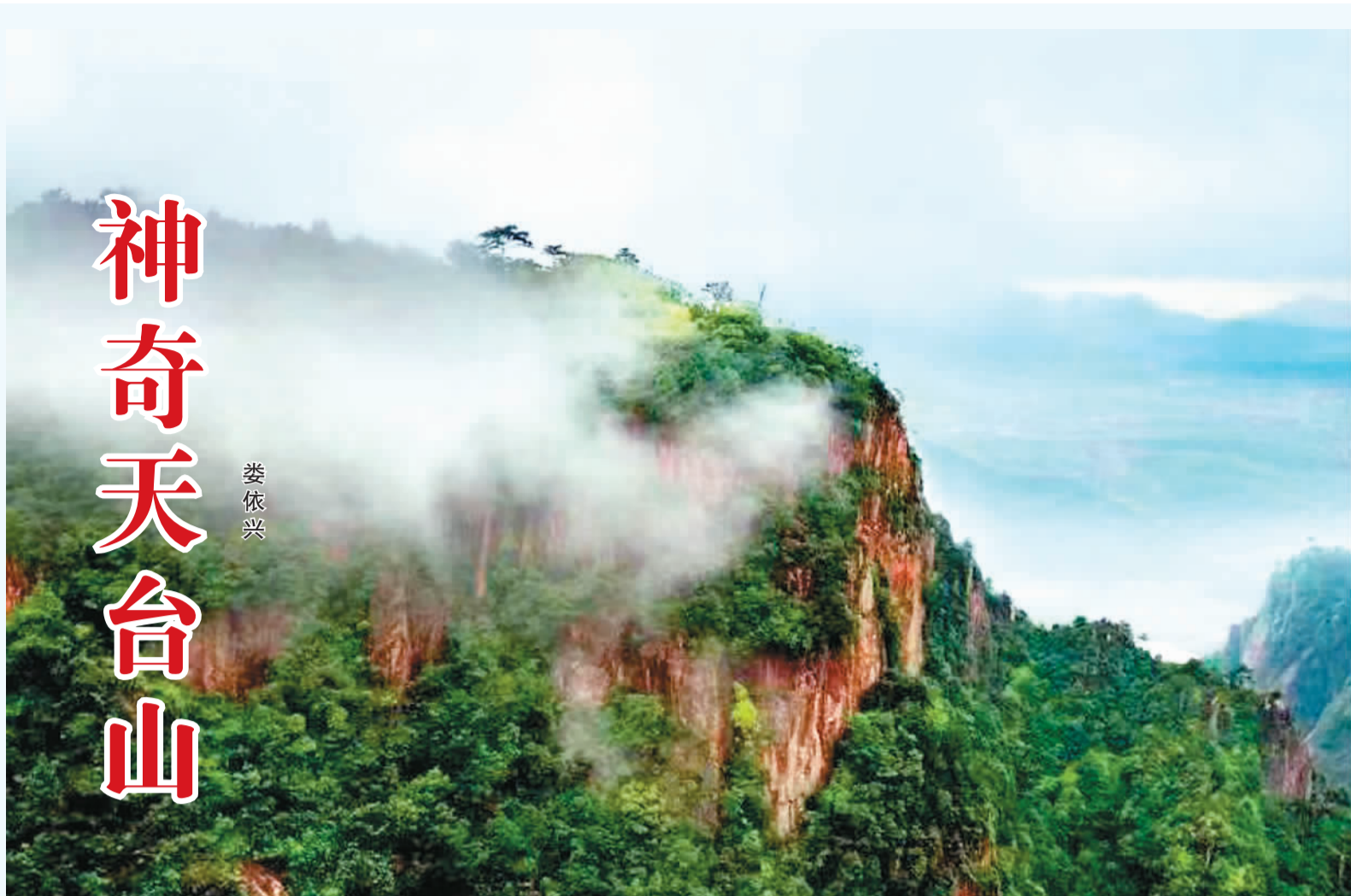
如仙境般的天台山。