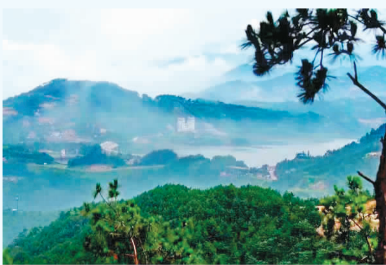
左下图：天台山一景。 右下图：天台山的寺庙。

如今的天台山，寺院与道观的数量在县一级达到全国第一，既有省级的佛教教育机构浙江佛学院，也有省级的道教教育机构浙江道学院。那穿越千年的佛寺道宫，隐藏着多少超脱凡尘的思绪；那缭绕于山间的云雾，似乎充满仙气，让人想象仙人的身影与足迹；那神采飞扬的锦鲤杜鹃，见证了天台山千百年来高僧高道大儒相继登场，圣诗仙游圣先后到来。神奇的天台山，成就了博大精深的天台山文化。