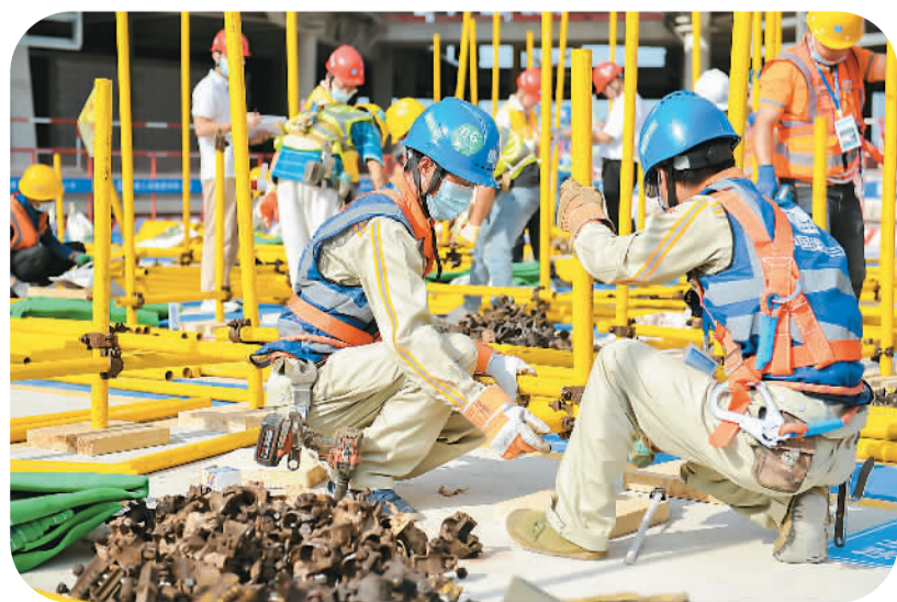
海南省建筑业职工职业技能竞赛日前在海口市中建三局江东发展大厦项目地举行。本次技能竞赛分架子工、手工木工两个项目，来自海南省住建系统17家建筑企业的184名选手报名参赛。图为比赛现场。

尹力同志兼任北京市委委员、常委、书记，不再兼任福建省委委员、常委、委员职务；周祖翼同志任福建省委委员、常委、书记。