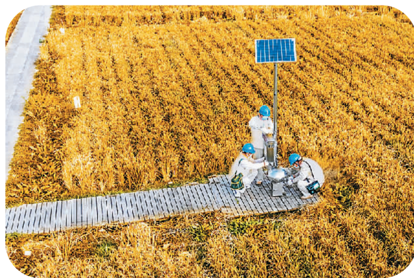
江苏省南京市江宁区供电公司近日在农村开展电力线路检修、加工机器用电检查等护农行动，帮助粮农解决用电问题。图为在江宁区淳化现代农业产业园内，电力工人在稻田里检查光伏板等用电设备。