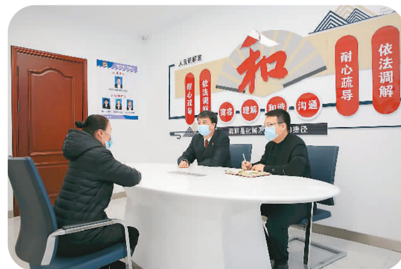
黑龙江省鹤岗市向阳区积极开展“法律服务进社区”活动，通过组织法律工作者、志愿者深入社区一线开展矛盾调解，完善矛盾、纠纷化解工作体系。图为向阳区检察院工作人员在对信访诉求人进行心理疏导。