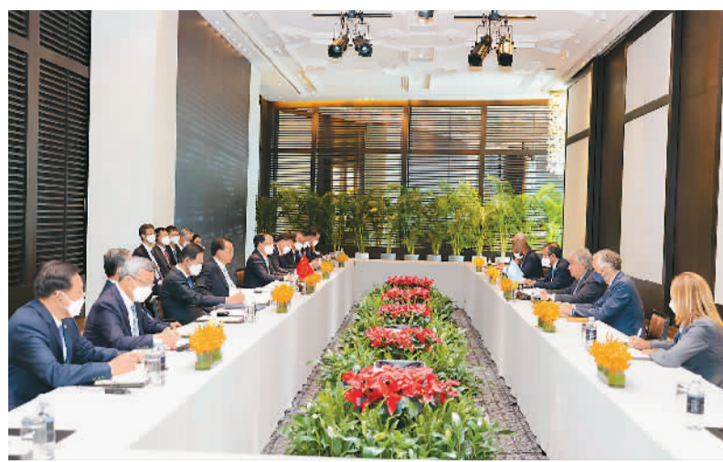
当地时间11月13日下午，国务院总理李克强在金边会见联合国秘书长古特雷斯。

与会领导人表示，面对当前国际紧张局势和多种挑战，地区国家应当保持团结一致，坚持相互尊重，开展对话合作，践行开放包容的多边主义，维护共同利益，应对共同挑战。东亚峰会应继续在推进战略对话和实质性合作方面发挥应有作用。要加强东盟在东亚合作中的中心地位，深化经贸、能源、粮食、互联互通、数字经济、应对气候变化等领域合作，共同促进经济复苏和可持续发展，构建和平、和谐、繁荣的东亚地区。肖捷出席会议。