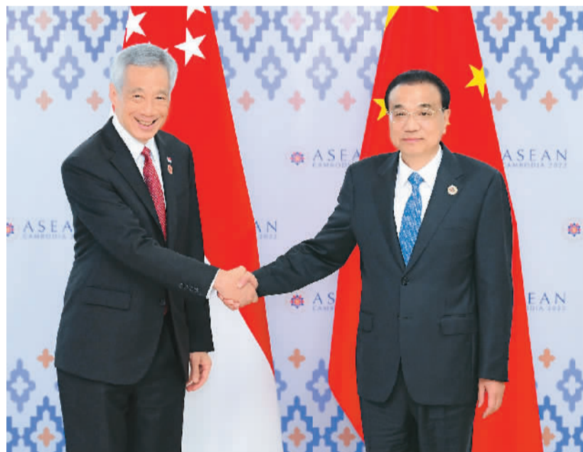
当地时间11月11日，国务院总理李克强在金边会见出席东亚合作领导人系列会议的新加坡总理李显龙。

新华社金边11月11日电（记者毛鹏飞、孙一）当地时间11月11日，国务院总理李克强在金边会见出席东亚合作领导人系列会议的新加坡