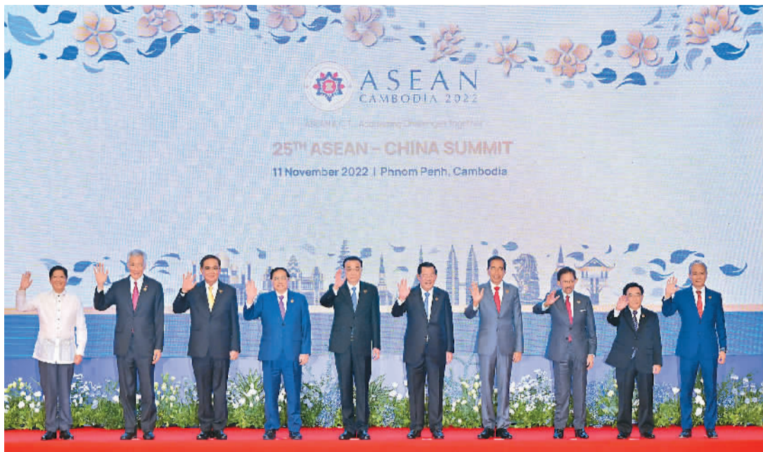
当地时间十一月十一日下午，国务院总理李克强在柬埔寨金边出席第25次中国—东盟（10+1）领导人会议。这是与会领导人集体合影。

新华社金边11月11日电（记者吴黎明、吴长伟）当地时间11月11日下午，国务院总理李克强在柬埔寨金边出席第25次中国—东盟（10+1）领导人会议。东盟轮值主席国柬埔寨首相洪森、文莱苏丹哈桑纳尔、印尼总统佐科、老挝总理潘坎、菲律宾总统马科斯、新加坡总理李显龙、泰国总理巴育、越南总理范明政、马来西亚国会下议长阿兹哈与会。东盟秘书长林玉辉出席。 李克强表示，去年11月，中国东盟举行建立对话关系30周年纪念峰会，宣布建立全面战略伙伴关系。习近平主席在峰会上提出共建和平、安宁、繁荣、美丽、友好“五大家庭园”。中国东盟友好合作揭开了充满希望的新篇章。 李克强指出，当前国际地区形势深刻复杂演变，各种不确定不稳定因素增多。中国与东盟是命运与共、休戚相关的全面战略伙伴，选边站队不应是我们的选择，开放合作才是克服共同挑战的必由之路。中方视东盟为周边外交的优先方向，始终支持东盟共同体建设，支持东盟在东亚合作中的中心地位，愿同东盟一道聚焦发展与合作，建设更为紧密的中国—东盟命运共同体。李克强建议： ——进一步凝聚发展合作共识。深入对接发展战略，以实施《中国东盟全面战略伙伴关系行动计划》为契机，推动双方务实合作提质增效。中方将设立中国东盟共同发展专项贷款，愿进一步加大对疫后复苏合作。 ——不断增强发展动能。深挖双方合作潜力。疫情发生近3年来，中