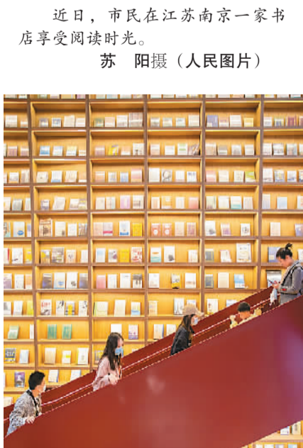
近日，市民在江苏南京一家书店享受阅读时光。