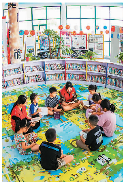
江苏海安高新区文化志愿者在田庄村农家书屋与儿童一起阅读。