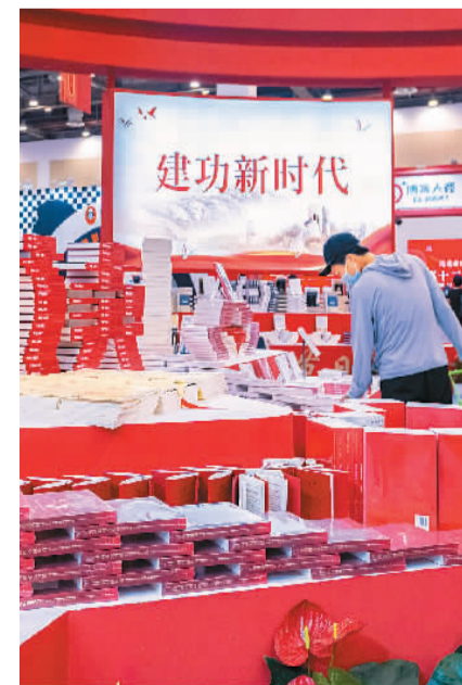
第十二届江苏书展现场，读者在选购图书。