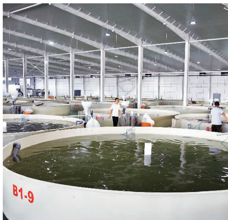
▲ 微山县现代渔业产业园内的智慧渔业车间。