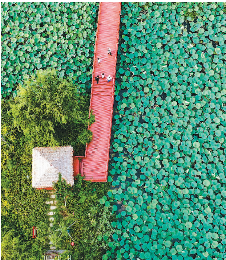
▲ 微山湖十万荷花盛开。 洪晓东摄（人民视觉） ▶ 微山湖上碧波荡漾，菱藕飘香，夕阳、彩云、渔人、鸭群等，构成美丽水乡图画。 洪晓东摄（人民视觉）