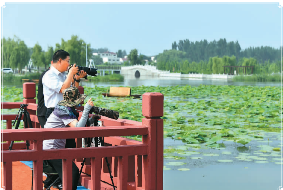
▲ 摄影爱好者在微山湖拍摄野生鸟类。

南四湖位于江苏、山东两省交界处，从南向北由微山湖、昭阳湖、独山湖、南阳湖4个相连的湖泊组成，民间多以面积最大的微山湖代称南四湖。这里自古便是大运河“千里赖通波”的航运要道，如今又成了南水北调东线工程输水干线和重要调蓄水库。 深秋的微山湖，鱼虾满塘，菱藕飘香，一派欣欣向荣。但在上世纪末，微山湖周边煤矿、造纸厂、化肥厂、水泥厂等重污染企业林立。汇入这里的53条河流上，分布着4000多个排污点，入湖河水