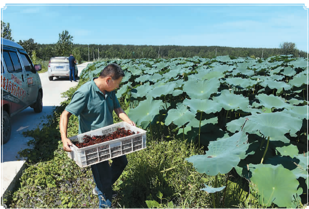
▲ 在山东省济宁市微山县高楼乡，一名村民在生态藕虾混养园区内投放虾苗。